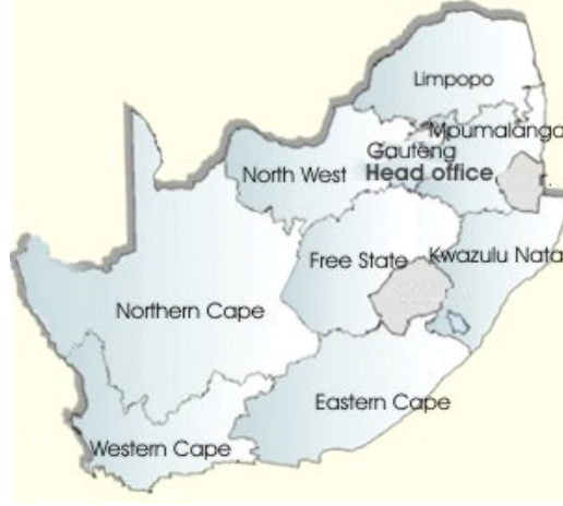
Şekil 1: Güney Afrika Cumhuriyeti Bölgeleri (Provinces) Haritası