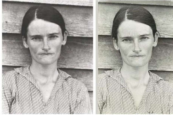
Resim 3: Sherrie Levine, ‘Walker Evans’ dan Sonra’, 1981.

Levine, Post-WalkerEvans (Resim 3) adlı serisinde, Walker Evans'ın yapıtlarının fotoğraflarını çekmiş ve kendi imzasını atarak yeniden üretmiştir. Böylece Levine, görüntüleri ait olduğu çevre ve içinde bulunduğu koşulların söyleminden kopartarak, başka bir anlam kazanacağı farklı bir çevreye taşımaktadır.