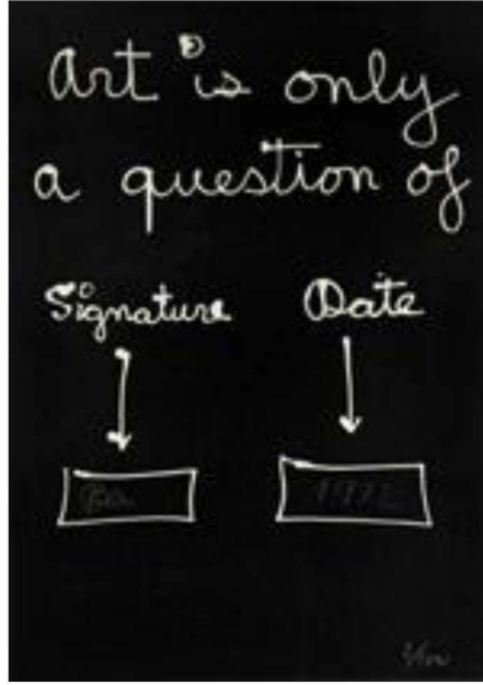
Resim 8: Ben Vautier, ‘Sanat Sadece Bir İmza ve Tarih Sorunudur’, 1972.

dönemin yüksek sanatının kültür ve değer niteliğini belirleyen tarih sorununa, hem de sanatçının özerkliğini belirleyen ‘benlik’ anlayışına eleştiri getirmiştir.