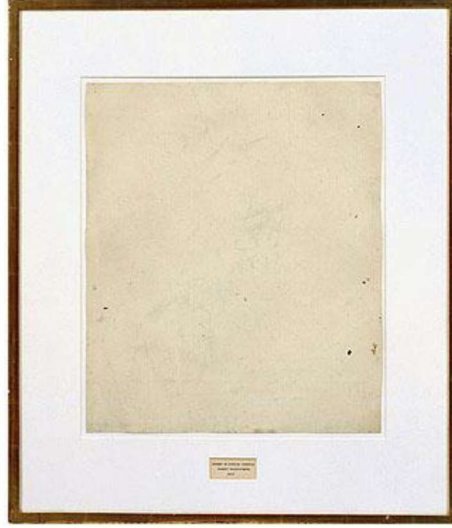
Resim5: Robert Rauschenberg, 'Silinmiş de Kooning Deseni' ,1953.

“Rauschenberg, daha sonraları bu silme işlemini ‘öğrendiklerini silip, yok etme’ isteği olarak açıklar. Böylece; ‘Silme’ kavramı burada, şiddetli bir yıkımdan çok bir temizlenme ve arınma olarak önerilmiştir. Rauschenberg, bu çalışmasının asıl amacının ‘bir desenin silinerek de gerçekleştirilebileceği’ni göstermek olduğunu vurgulamaktır” (Şahiner, 2009:167).