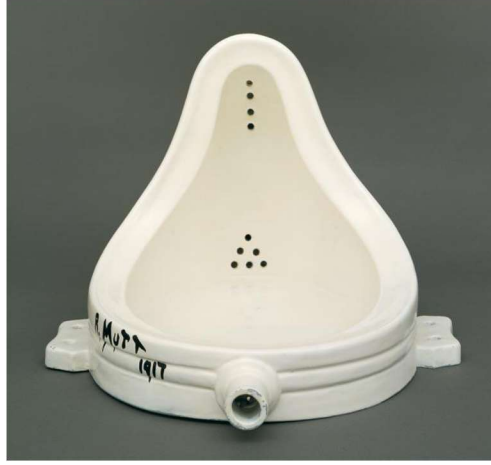
Resim 1: Marcel Duchamp, ' Fountain ', (Çeşme), 1917.

olarak tanıyan Marcel Duchamp'ın Fountain 2 (Çeşme) çalışmasıdır (Resim 1).