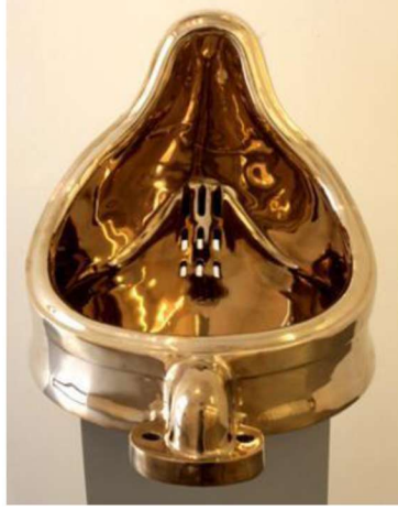
Resim 2: Sherrie Levine, Fountain , (Marcel Duchamp’dan Sonra), 1991.

işindeki söylemi ve arzuyu dikkate alan Sherrie Levine, ‘ Fountain ’ (Resim 2) çalışmasını kendi arzusu doğrultusunda pastiş 3 yöntemi ile yeniden kodlayarak üretir. Çünkü Levine için o, sadece ‘R.Mutt’ imzalı bir çeşmedir; Duchamp’ın değil, hayal ürünü birinin yapıtıdır.