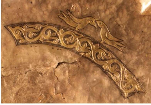
Resim 2: Tabak 1'den detay.

Tabak 1 daire şeklinde yıldızlı kakma-kabartmalı XII-XIII. yüzyıl yapımı İdil Bulgarlarına ait gümüş bir tabaktır ( Resim 1 ). Tabanın tam merkezindeki daire içinde, arka planda bitkisel formda süslemelerin bulunduğu, bir geyiğe saldıran kurt motifinin yer aldığı kut-güç alış-veriş sahnesi görülmektedir. Bu mücadele sahnesini çevreleyen üç parçadan oluşan bitkisel süslemeli şeridin üstünde, birbirlerine karşılıklı bakan bir çift kuş ( Resim 2 ) durmaktadır. Bitkisel süslemeli şeridin parçaları arasında üçgenler içinde iki adet aynı kuştan, bir adet ise kuş başını andıran bitkisel süslemenin başlangıç noktasını oluşturan figür ( Resim 3 ) yer almaktadır. Tabanın en dışında ise tabağın sadece yarısını çevreleyen zencerek motifi bulunmaktadır.