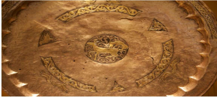
Resim 1: Tabak I: Bir vahşi hayvanın bir geviğe saldırısı sahnesi, Yıldızlı kakmakabartmalı, kararmış gümüşlü tabak. Barsov Gordok arkeolojik alanı, Surgut bölgesi, 1975. Envanter No: ZO-743. İdil Bulgarları XII-XIII. yüzyıl, Ermitage Devlet Müzesi, (Yücel-Sazak, 2012).

yüzyıl Yamal 64 . N. V. Federov ise B. I. Marşak'ın ayırdığı bu üç bölümü Bulgar, Macar-Ural, günümüz Batı Sibiryası olarak tanımlamıştır. N. V. Federov, aslında bu bölümlerin maden sanatının temelini; ikonografik (binici, doğancı ve vahşi hayvan), mitolojik konuları ve resim üslubu açısından eski Ural Ekolü'ne dayanmakta olduğunu tespit etmiştir. Bu maden eserlerdeki silah, at ekipmanı ve giyim süslemeleri de eski Bulgarlarla aynıdır 65 . B. İ. Marşak Ural bölgesi ve kuzeydeki boyların, VI-VII. yüzyıllar arasında Sogd ve Harezmi bölgesinden ticaret yoluyla gümüş, altın tabak ve ziyafet takımlarını alıp kürk sattıklarını belirtmiş, Sogd ve Harezmi bölgesi maden işçiliğini Ural madenlerinden daha ince işçiliğe sahip olması yönüyle ayırmıştır 66 . Rus ilim adamlarının araştırma konumuz olan üç tabak için ortak olarak vardıkları sonuç: tabakların İdil Bulgarlarına ait oldukları; İdil Bulgarlarının sanat için madeni kullanmalarının temelini M.Ö. 1000'li yıllardan itibaren Sibiryalı-Ural hattına dayandığı; tabakların içindeki motiflerin ikonografik ve üslub olarak M.Ö.1000'den X. yüzyıla kadar Ural Ekolü'ne dayandığıdır. Ayrıca Rus ilim adamları tabakların içindeki motiflerin neyi sembolize ettiğinin hala çözemediğini bu konunun karmaşık bir konu olduğunu da kabul etmişlerdir 67 .