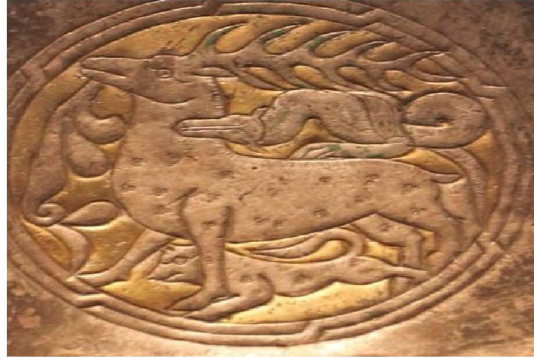
Resim 13: Tabak III'ten detay. Kurt başlı böke'nin (yılan) geyikle mücadelesi.

Tabak III'de alplık kazanmak için yapılan kut-güç alış-veriş sahnesi 'ndeki kurt başlı böke (yılan) Alp'i, geyik Alp'in yenmesi gereken düşmanı, geyik'in sol tarafında aşağı doğru sarkan yılan'la aynı formdaki boynuz geyiğin kırılan boynuzunu, geyik'in ve kurt'un üzerlerinde üç daireden meydana gelen çintemani 95 motifi ise alp'in düşmanlarını yendiğini ve alplık sembolü olarak çintemani bu motiflere (geyik ve kurt) aktarıldığını ifade etmektedir (Resim 13).