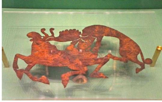
Resim 4: Kut-güç alış-veriş sahnesi, Deri Aplik, Pazırık Kurganı. Envanter No:1295/250 M.Ö.5-4.yüzyıl, Ermitage Devlet Müzesi, (Yücel-Sazak 2012).

aynıdır. Tek fark Pazırık'ta geyiği kurt yerine bars avlamaktadır. Bu da Türk boyları arasındaki ongun farklılıklarından kaynaklanmaktadır.