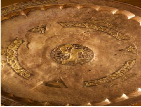
Resim 6: Tabak I'in esas duruş şekli. Tabak sol dış kenarında zencerek, üstte böke yukarı doğru yükselen kurt ve geyik.

Tabağın Resim 6'daki gibi duruşu, zencerek motifinin de sol tarafı yani Türklerin batı kanadını temsil etmektedir. Batı kanadı da tabağı yapan İdil Bulgarlarının Türk coğrafyası içinde bulunduğu yönü işaret etmektedir.