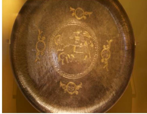
Resim 7: Tabak II: Bir Adam, geyik ve bir yırtıcı kuş (kartal), altın varak kabartmalı gümüş tabak Tomsık Bölgesi, Ural ve Batı Sibirya. İdil Bulgarları X. (?) yüzyıl, Ermitage Devlet Müzesi, (Yücel-Sazak, 2012).