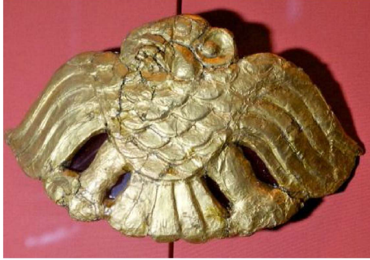
Resim 9: Ahşap üstü altın kaplama, Kartal Motifi, eyer Süsü, Başadar Kurganı, 6-7th B.C., Ermitage Museum, (Yücel-Sazak, 2012).

Kartal/Doğancı/Tuğrul kısaca yırtıcı kuş ikonografisi hakkındaki en eski yazılı kaynak Beyzare'nin Sahib-i Türk/ Melikü't- Türk adlı kaynağa dayanarak doğancılık üzerine halife Mehdi (775-85) için yazdığı Arapça bir risalede geçmektedir 79 . Beyzare'de olduğu gibi pek çok Rus kaynağa göre de Hazar Harezm kağanlığı bölgesi ve Hazar Denizi kıyılarında yırtıcı kuş ikonografisinin eski bir gelenek olduğu yazılmaktadır. Bu kaynaklara göre; M.Ö. 1000'de makalemizde geçen tabakların yapım ve bulunuş yeri olan Kama Irmağı bölgesinde Ananino kültürüne ait ilk bronz yırtıcı kuş figürleri bulunmuştur 80 . Rus kaynaklarında Obi bölgesi sahasındaki yırtıcı kuş figürleri Uğurlarla ilişkilendirilmektedir 81 . Öte yandan tabaktaki kuşun duruşu ile aynı duruşa sahip kartal /yırtıcı kuş figürünü, Altay bölgesinde M.Ö. 6-7. yüzyıla ait Başadar kurganından çıkarılan ahşap-altın kaplama kartal figüründe de görülmektedir (Resim 9).