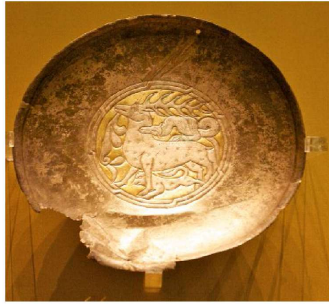
Resim 12: Tabak III: Yılanın Geyiğe Saldırması, Yıldızlı Gümüş Tabak, Ural Bölgesi ve batı Sibirya, İdil Bulgarlar, X. yüzyıl, Ermitage Devlet Müzesi, (Yücel-Sazak, 2012).

Tabak II'de yırtıcı kuş, geyik ve silahsız olarak resmedilmiş alp motiflerinin birlikte yer aldığı sahne; Türk kültüründe Alp'in ruhunun ölümden sonra bir kartal olarak Tann'ın yanına, bu yolculukta ve diğer dünyada kendisine yardım etmesi için kurban edilen geyik ile birlikte uçmasını sembolize etmektedir. Tabaktaki alp, kartal ve geyiğin üçünün de