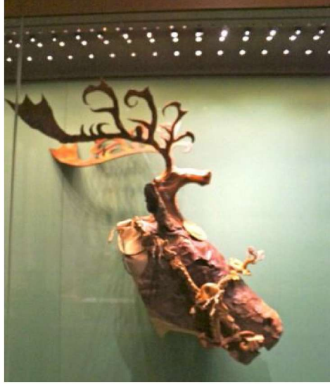
Resim 10: Deri At Koşum Takımı, Pazırık Kurganı 5, 4-3-th B.C., Ermitage Devlet Müzesi, (Yücel-Sazak 2012).

Türklerde kutsal hayvan olan geyik, yırtıcı bir kuşla tasvir edildiğinde; kurban edilerek öbür alemde canlanacağına ve tabiatüstü bir özellik taşıdığına inanılan geyiği temsil etmektedir 85 . Tabak II'deki geyik motifi de yırtıcı bir kuş'la birlikte resmedilmiş olduğundan Alpin ruhu için adanan kurbanı sembolize etmektedir. Pazırık Kurganları'ndan çıkarılan kağanın ruhuna kurban edilmiş ve onunla birlikte kurgana konulan muhteşem deri, altın ve at kılı bezemeli geyik maskeli atlar da aynı anlamda kurban edilmiş geyiği sembolize etmektedir ( Resim 10 ).