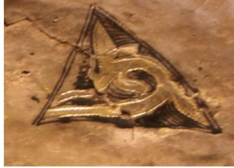
Resim 3: Tabak 1'den detay.

Kut-güç alış-veriş sahnesi 'nde yer alan kurt, Türklerde bir hayvan ata sembolü ve Türklerin kutsal bir hayvanı idi 68 . Yaşadıkları coğrafyanın zorlu koşullarını onlarla birlikte yaşayan ve paylaşan en güçlü hayvan kurt idi. Millî kült haline gelmiş olan bu hayvanın Tanrı ile bağlantı kurduğuna inanılıyordu 69 . Aynı sahnede avlanan geyik ise Türkler için kurt gibi kutsal bir hayvandır. Geyik motifi dağ keçisi motifi ile birlikte M. Ö. 1000'li yıllardan itibaren İskitler de dahil olmak üzere Avrasya'da yaşayan bütün Türk boylarında tasvir edilmiş ve ongun olarak kabul edilmiştir 70 . Dede Korkut'ta erkeği için buğa (boga, buka) kelimeleriyle karşılanan sığır cinsi hayvan 71 , yer-su kültürünü temsil eden tüm toynaklı hayvanların erkek cinsleri için kullanılmıştır 72 . Yukarıda av kültüründen bahsettiğimiz alplık ve ad almayı temsil eden kut-güç alış-veriş sahnesi Tabak 1'de geyiği avlayan kurt motifi ile sembolize edilmiştir. Bu sahne M.Ö. V-IV. yüzyıla ait Pazırık kurganlarından çıkarılan deri bir aplik üzerinde de görülmektedir ( Resim 4 ). İki sahne hayvanların konumları, kurtun geyiği avlarkenki hamlesi ve hayvanların resmedilme üslûbu açısından birebir