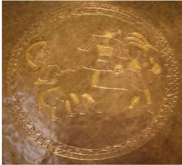
Resim 8: Tabak II'den Detay.

Araştırma konumuz olan Tabak II, Ermitaj'da Obi hazinesi adı altında sergilenmiştir. Tabak II daire şeklinde X. yüzyılda yapıldığı düşünülen İdil Bulgarlarına ait altın varak kabartmalı gümüş bir tabaktır (Resim 7). Tabağın tam merkezindeki geometrik süslemenin çevrelediği daire içinde yırtıcı bir kuşun, bir geyiğin ve bir alpin yer aldığı mitolojik bir sahne bulunmaktadır (Resim 8).