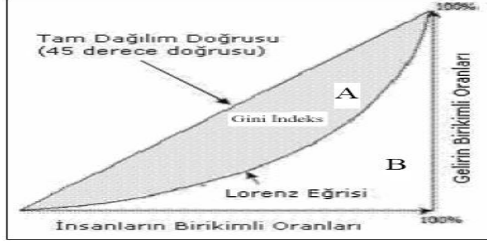
Şekil 2: Gini İndeksi- Lorenz Eğrisi