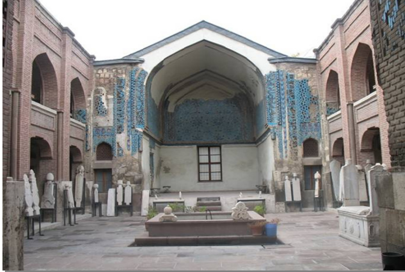
Resim 2: Konya Sırçalı Mescit