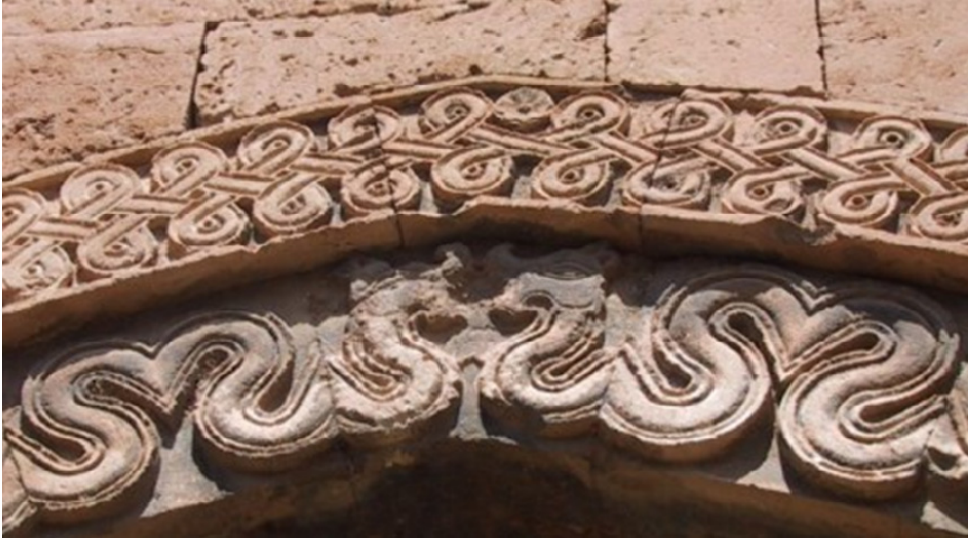
Resim 4: Kayseri Tuzhisarı Sultan Hanı Köşk Mescit Kemerindeki Ejder Figürleri