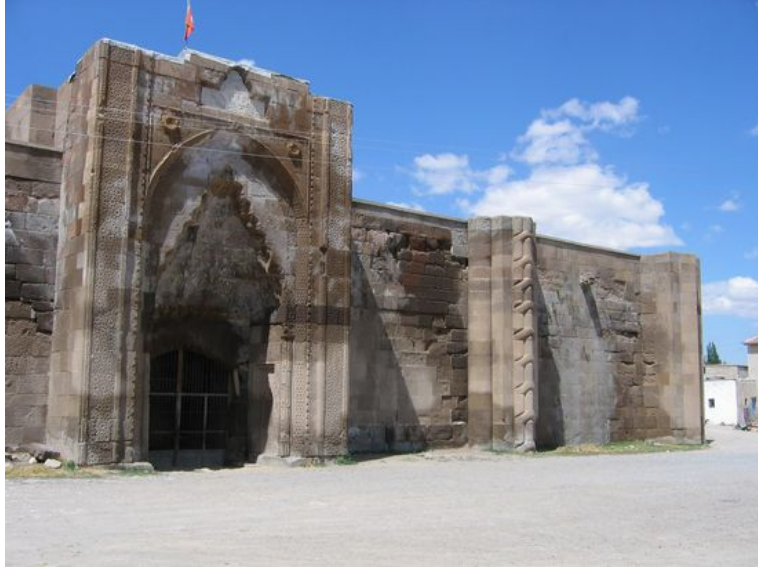
Resim 1: Kayseri- Tuzhisarı Sultan Han