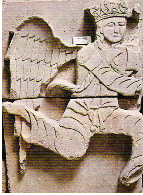
Resim 3: Konya Kalesi, Selçuklu Dönemi Melek Rölyefi