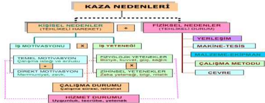
Şekil 2 İş Kazalarının Nedenleri

Çalışma hayatının en önemli sorunlarından birisi olan iş kazalarının birçok nedenleri bulunmaktadır. İş kazalarıyla ilgili yapılan araştırmalara göre; kazaların meydana gelmesinde çoğunlukla çalışanların birtakım kişisel özellikleri etkili olmaktadır. Bunun yanında makine, teçhizat ve çalışma ortamındaki hata ve eksiklikler iş kazalarının oluşmasına etki etmektedir (Camkurt, 2013: 70). İş kazalarının nedenleri Şekil 2'de gösterilmiştir.