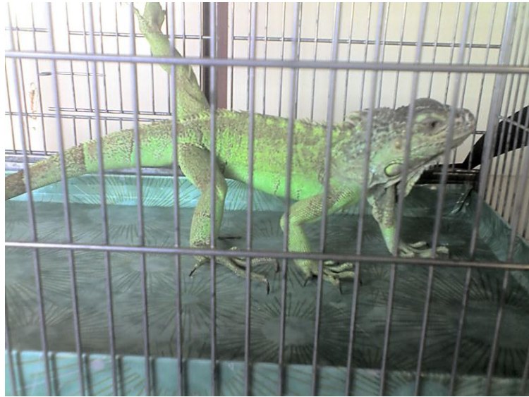
Şekil 1. Bu olguda sunulan yeşil iguana.

İstanbul'da, halsizlik, iştahsızlık, zayıflama gibi şikayetlerin yanı sıra, dışkıında bazı parazitler görüldüğü anamnezi ile getirilen 2 yaşında ve yaklaşık 900 g ağırlığında dişi bir yeşil iguanada ( Iguana iguana ) (Şekil 1) gaita muayenesi yapılmıştır. İguana San Salvador'dan ithal edilmiştir.