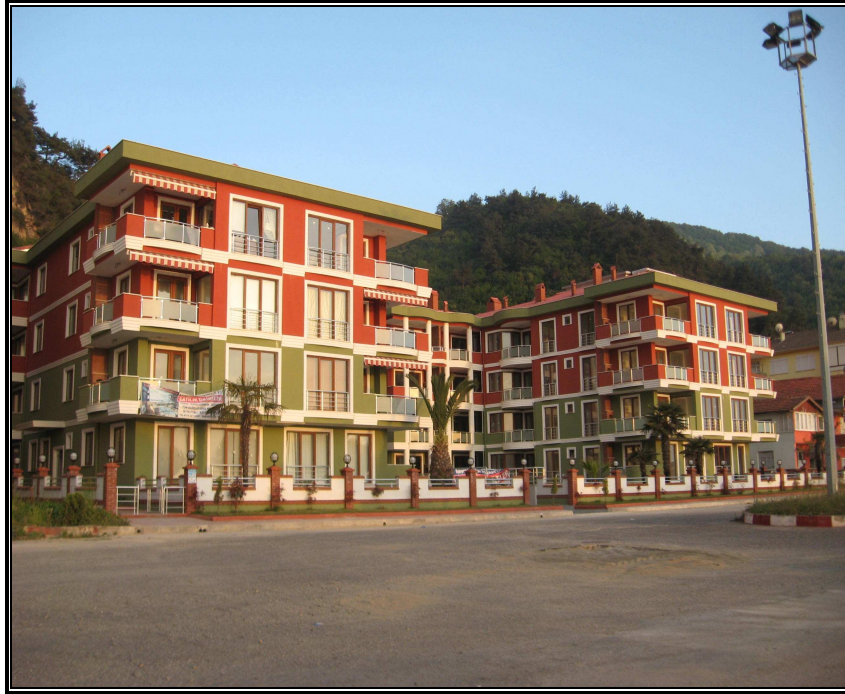
Fotoğraf 3. İnkumu rekreasyon alanındaki konutlardan bir görünüm.

Plaj genişliğine göre kıydan 60 m ila 100 m içeride kurulmuş olan ikincil konutlar, plajın gerisinde sarp bir şekilde yükselen İnkumu Dağı ile plaj arasındaki 80 m ila 130 m arasında değişen dar bir düzlükte sıkıştırılmış durumdadır. Çoğunlukla dört kattan oluşan bu konutların, araçların giremeyeceği kadar dar sokaklarla birbirinden ayrıldığı bu yüzden caddelere bakanlar hariç güneş ışınlarını yeterince alamadıkları ve çoğunlukla deniz manzarasından yoksun oldukları görülür (Fotoğraf 3). Ayrıca dar sokakların çöp toplama ve tıkanan kanalizasyonları açmak için vidanjör kullanımı gibi belediye hizmetlerini aksattığı yetkililerce ifade edilmektedir.