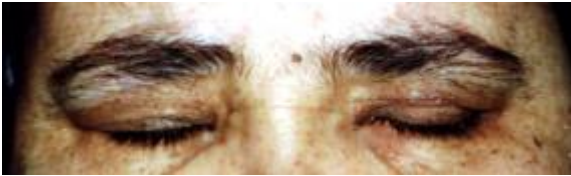
Şekil 4b. Üç numaralı hastanın ameliyat sonrası 9. aydaki görünümü