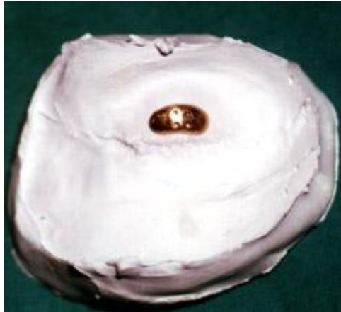
Şekil 2. Üst göz kapağından alınan alçı kalıp ve altın ağırlık