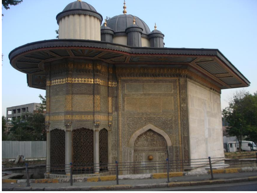
Resim: 7- Saliha Sultan Çeşmesi ve