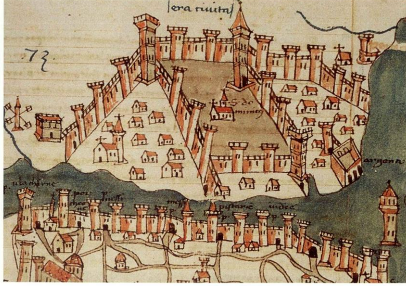
Resim: 1- Boundelmonti'nin En Eski İstanbul Tasvirinde