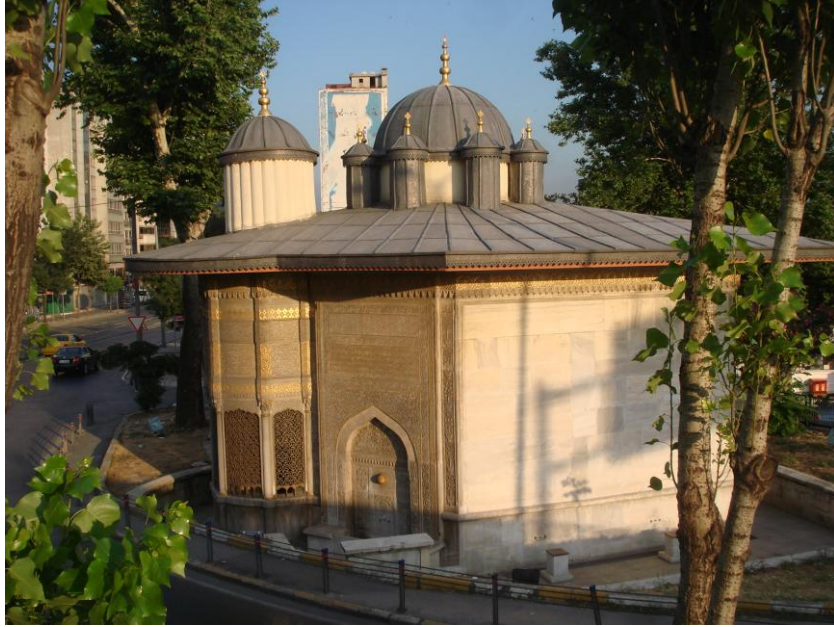
Resim: 6- Saliha Sultan Çeşmesi Batı