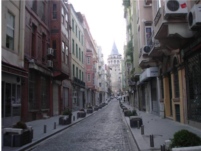
Resim: 4- Galata Kulesine Açılan