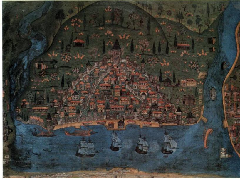
Resim: 2- 16. Y.Y. Matrakçı Nasuh'un Galata