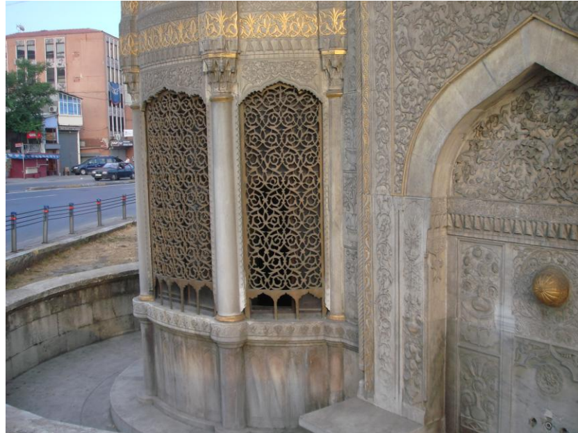
Resim. 10- Saliha Sultan Çeşmesinin Günümüzde Yol