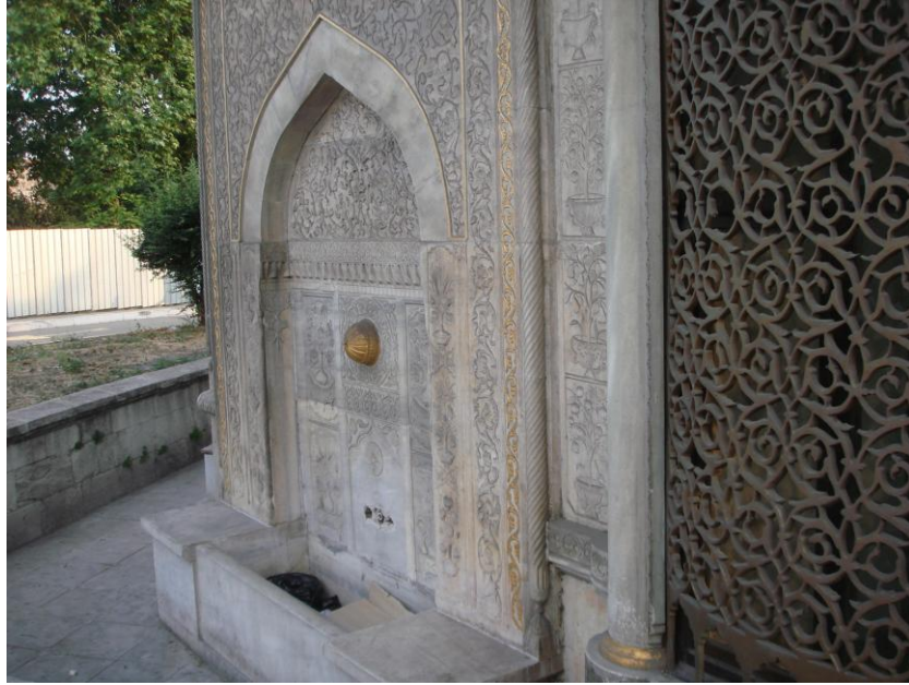
Resim: 8- Saliha Sultan Çeşmesi Çeşme Bezemeleri ve Pencere Sebekesi