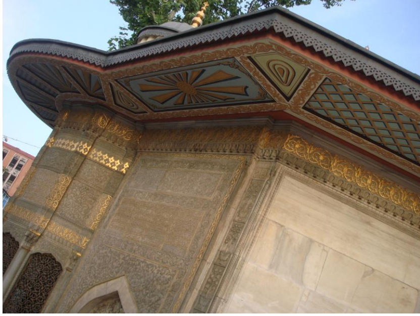
Resim: 9- Saliha Sultan Çeşmesi Saçak Altı