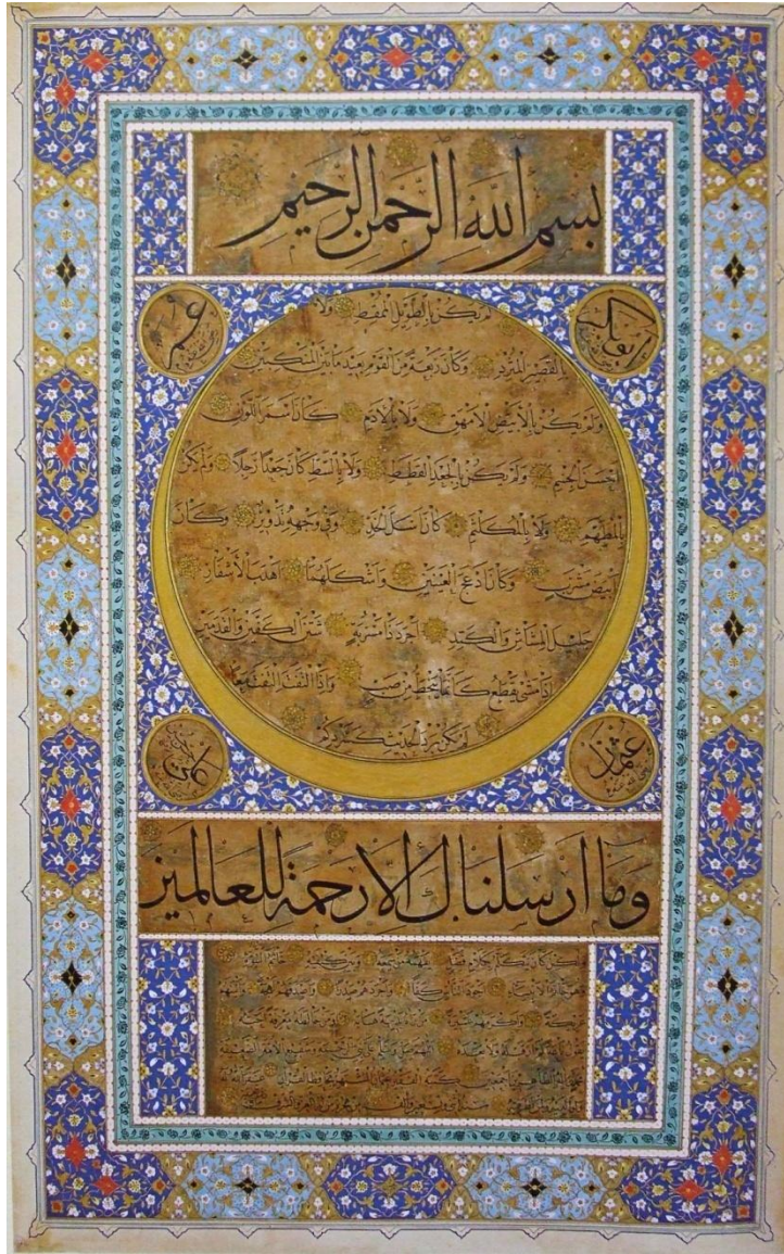
Resim 1: Hâfiz Osman'ın hilye-i saâdet levhası (Serin)