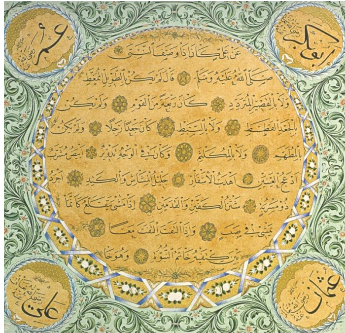
Resim 3: M. Şevkî Efendi hilyesinin göbek kısmı