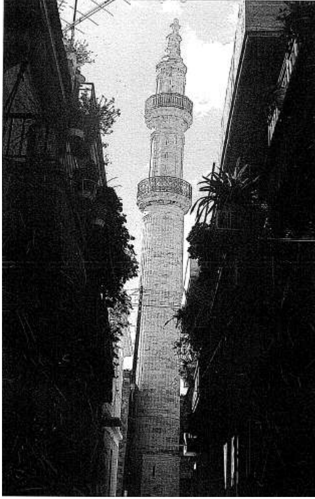
Resim 5: Resmo, Gâzî Hüseyin Paşa Câmii Minâresi (Nusret Çam)