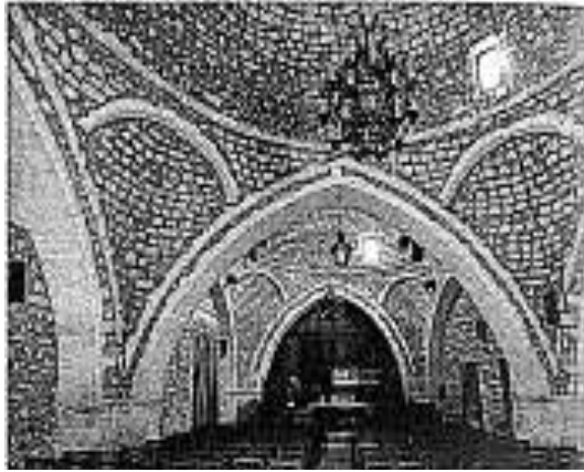
Resim 2: Resmo, Gâzî Hüseyin Paşa Câmii İçinden Bir Kesit (Konstantinos Giapitsoglou)