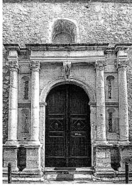
Resim 3: Resmo, Gâzî Hüseyin Paşa Câmii Giriş Kapısı (Konstantinos Giapitsoglou)