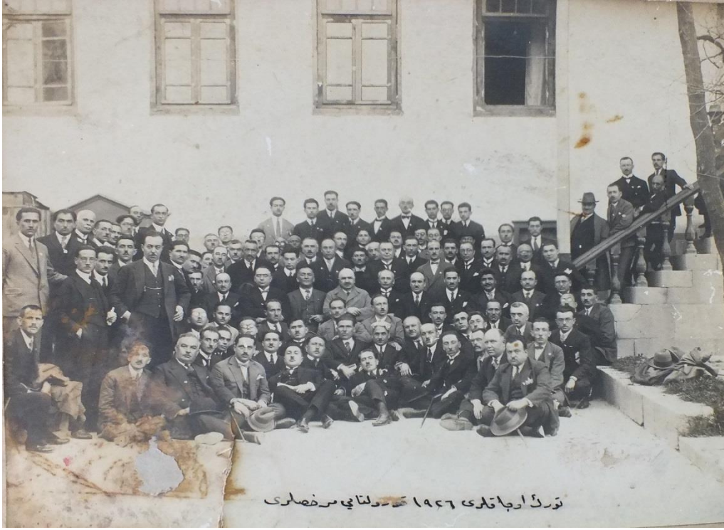
Resim 3: 1926 Türk Ocakları Kurultayı Murahhasları