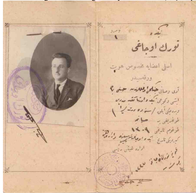
Resim 1b: Niğde Türk Ocağı Hüviyet Varakası (iç Kapak)