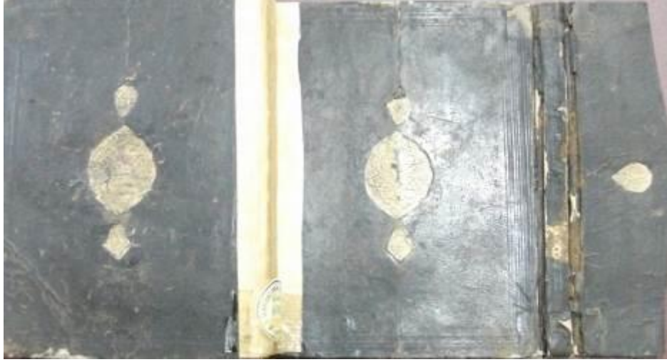
Resim 2: Tarih-i Mısri'l-Cedid ve Tarih-i Mısri'l-Kadim Adlı Eserin Cilt Kapakları

Tarih-i Mısri'l-Cedid ve Tarih-i Mısri'l-Kadim 'dir. Eserin cilt tezyini mülemma şemse* tekniği ile yapılmış bitkisel kompozisyonlu, dendanlı, salbekli şemse bulunmaktadır. Aynı kompozisyon arka kapakta da görülmektedir. Salbekli şemsenin etrafında dört bordür bulunmakta ve mikleb kısmında ise madalyon tarzında bir kompozisyon görülmektedir. (Resim 2)