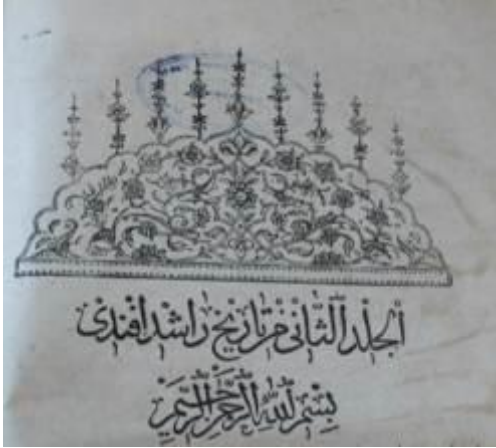
Resim 13: Tarih-i Raşid II. Cildin Unvan Sayfası Tezvinatı

Tarih-i Raşid kitabının üç cildi ve de Tarih-i Çelebizâde kitabının ilk sayfalarının kompozisyonları, Tarih-i Naima kitabının ilk sayfasının kompozisyonuyla aynıdır. Taç tezvinlerinde aynı kalıbın kullanıldığı görülmektedir. (Resim 13-14)