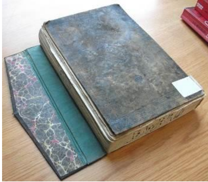
Resim 1: Vankulu Lügati I. Cilt

Müteferrika İbrahim Efendi'nin ilk bastığı eser olan Vankulu Lügati 'nin iki kopyasının ciltlerinin birbirlerinden farklı şekilde yapıldığı görülmüştür. Bir kopyasının cildi sonradan yapılmış olduğu diğeri ise o dönemden kaldığı anlaşılmaktadır. Vankulu Lügati 'nin sonradan yapılmış olan cildi cilt bezi ile yapılmış, diğeri ise deriden yapılmıştır. Her ikisinin de mikleb ve Sertab bölümleri bulunmaktadır. Vankulu Lügati 'nin birinci cildinin üzerinde soğuk şemseli* cilt tekniği ile yapılmış hatai grubu, bitkisel motif kompozisyonlu, dendanlı,** salbekli*** şemse görülmektedir. Salbekli şemsenin etrafında dört bordür bulunmakta ve mikleb**** kısmında da eserin salbek kısmındaki süslemenin aynısı görülmektedir. Kapak içine, mikleb ve sertabın***** iç kısmına ebrulu kâğıt sıvanmıştır. (Resim 1)