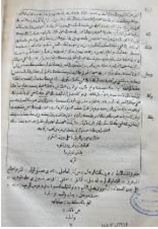
Resim 19: Vankulu Lügatı I. Cilt Hatime Sayfası

Eserlerin son sayfalarındaki yazılar ortaya hizalanarak sonlandırılmıştır. Bazı eserlerde bu tarz sonlandırmalar aynı sayfada iki defa yapılmıştır. İlk sonlandırma bölümün sonu için, ikincisi ise eser hakkında bilgi vermek için yapıldığı görülmektedir. İkinci kısımdaki sonlandırmada eserin yazarını, tercümanını, kimin tarafından basıldığını ve hangi matbaada kaç yılında basıldığı gibi bilgilerini bu bölümünden öğrenebilmekteyiz. (Resim 19-20) Bazı eserlerde ise bu sayfalarda tek sonlandırma bulunmaktadır. Konunun sonu ile kitap hakkındaki bilgi bu sonlandırmada birleştirilmektedir. (Resim 21)