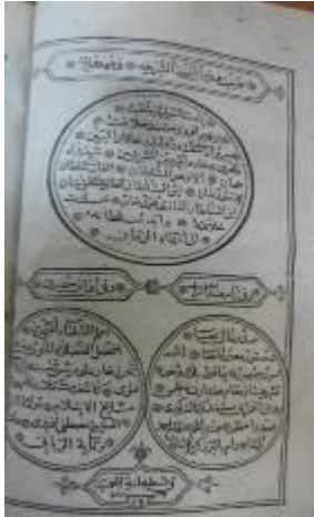
Resim 6: Tarih-i Râşid Adlı Eserin Zahriye Sayfası