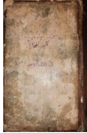
Resim 4: Tarih-i Seyyah Cildi

Ahvâl-ı Gazavât der Diyâr-ı Bosna adlı eserin iki kopyasına ulaşılmıştır. Bir tanesinin cildi son dönemlerde yapılmış diğeri ise XIX. yüzyılda yıldız sarayındaki mücellithanede yapılan yıldız cildi* diye adlandırılan kumaş cilt tekniği kullanılmıştır.