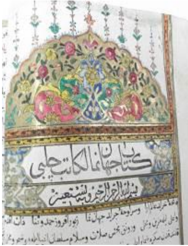
Resim 9: Cihannüma Unvan Sayfası Tezyinatı