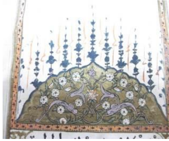
Resim 10: Ferheng-i Şu'ûri I. Cilt Unvan Sayfası Tezyinatı

Unvan sayfası tezyin edilen diğer eserlerde de benzer kalıplar kullanılmıştır. Usulü'l-Hikem fi Nizâmi'l-Ümem kitabının ilk sayfasının mihrabiye şeklinde taç tezhibi bulunmaktadır. Taç kısmında palmet, rumi motiflerinin aralarında özellikle penç motiflerinin kullanıldığı bitkisel bir kompozisyon görülmekte ve etrafında dendan üzerinde ince işlemeli yer yer bitkisel motiflerin kullanıldığı tığlar yükselmektedir. Kitabın isminin etrafında eşit ölçülerle oluşturulmuş geometrik geçme motifli cetvel bulunmakta, penç motifleri kullanılarak yapılmış sade bir bezeme grubu görülmektedir. Çerçevesiz olan sayfa kompozisyonu besmele ile birlikte 12 satırdan oluşmuş, sayfanın sol alt kısmında reddade kullanılmıştır. (Resim 11) Tarih-i Nâima kitabının iki cildinin de ilk sayfasının taç tezhibi mihrabiye tarzında oluşturulmuştur. Taç kısmı rumi, penç, sap, yaprak motiflerinin kullanıldığı kompozisyondan oluşmakta ve etrafında dendan üzerinde yer yer bitkisel motiflerin kullanıldığı tığlar bulunmaktadır. Süslemeyi metinden ayıran cetvel kısmında her hangi bir tezyin bulunmamaktadır. (Resim 12)