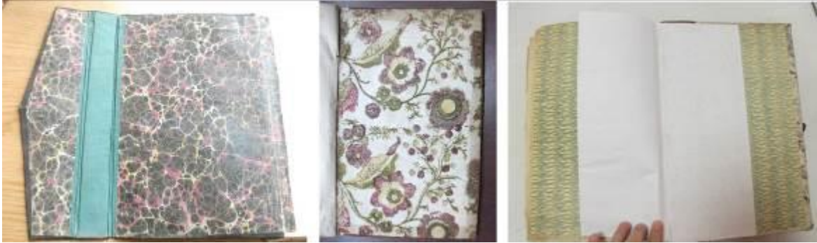
Resim 5: Vankulu Lügati I. Cilt, Ferheng-i Şu'ûri I. Cilt Ve Cihannüma Cilt Kapaklarının İç Yüzey Düzenlemeleri.

İlk basılan eserlerin cilt kapaklarının iç yüzeylerinde farklı uygulamalar görülmektedir. Bunlardan Ferheng-i Şu'ûri 'nin ve Vankulu Lügati 'nin II. cilt örneklerinde olduğu gibi önemli bir kısmında, üzerinde herhangi bir bezemenin olmadığı kâğıtlar kullanılırken Vankulu Lügati 'nin I. cildinde battal ebrulu kâğıt kullanılmıştır. Ferheng-i Şu'ûri 'nin I. cildinde bitkisel bezemenin kalıpla basıldığı kâğıt kullanılırken Cihannüma 'da daha basit baskı tekniğinin uygulandığı kâğıt kullanılmıştır. (Resim 5)