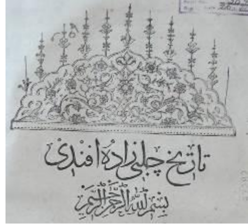
Resim 14: Tarih-i Çelebizade Efendi Unvan Sayfası Tezvinatı

Ahvâl-ı Gazavât der Diyâr-ı Bosna kitabının ilk sayfası ve Usulü'l-Hikem fi Nizâmi'l-Ümem kitabının ilk sayfasının tezvin kompozisyonu da aynıdır. Aynı kalıpla basılmış olabilir. (Resim 15) İkinci cildinin ilk sayfasının tezvin kompozisyonu ise Tarih-i Nâima , Tarih-i Raşid ve Tarih-i Çelebizâde kitaplarının ilk sayfasının tezvin kompozisyonuyla aynıdır. Aynı kalıp kullanılmış olabilir. (Resim 16)