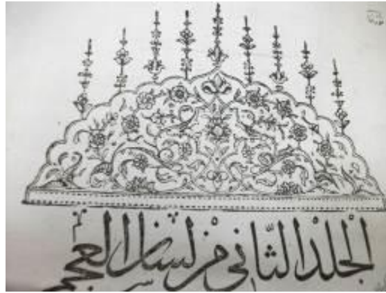
Resim 16: Ferheng-i Şu'ûri II. Cildinin Unvan Sayfası Tezminatı

Füyûzât-ı Mıknâtsiyye ve Takvîmü't Tevârih kitaplarının unvan sayfalarının taç tezhibleri klasik tarzda yapılmış olsa da diğerlerinden biraz farklıdır. Füyûzât-ı Mıknâtsiyye 'de sayfanın taç kısmında palmet, rumi motiflerinin aralarında yaprak, sap ve penç motiflerinin kullanıldığı bitkisel bir kompozisyon görülmekte ve etrafında dendan üzerinde ince işlemeli yer yer bitkisel motiflerin kullanıldığı tığlar bulunmaktadır. Kitap ismi geometrik geçme motifli cetvel ile çerçevellenmiş ve yazının her iki tarafında tezhip sanatında köşebent olarak adlandırılan alan bölümleri bulunmaktadır. Çerçevesiz olan sayfa kompozisyonunun sol alt kısmında reddade kullanılmıştır. (Resim 19) Benzer bir düzenleme Takvîmü't Tevârih kitabının unvan sayfası taç tezhibinde daha basit yapılmıştır. Bezemesinde palmet, rumi, penç, sap ve yaprak motiflerinin kullanıldığı bitkisel kompozisyonun etrafında dendan kullanılmıştır. Besmele ve kitabın ismi kalıp olarak basılmıştır. (Resim 21)