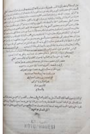
Resim 20: Tarih-i Çelebizâde Efendi Hatime Sayfası