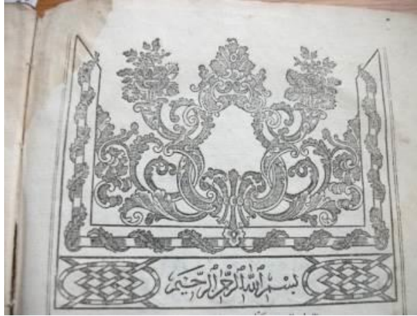
Resim 8: Vankulu Lügatı II. Cilt Unvan Sayfası Tezyinatı

Vankulu Lügatı 'nın birinci cildinin ilk sayfasında hiçbir tezyin görülmemektedir. İkinci cildinde taç tezhibi bulunmakta, bu taç tezhipte ise yüzyılın etkisinde kalınarak, barok ve rokoko etkisiyle bitkisel ve palmet motiflerin hakim olduğu bir kompozisyon düzenlemesi oluşturulduğu görülmektedir. Bu süslemenin her iki tarafında vazo görevi oluşturulmuş palmet motiflerin içerisinde şukufe tarzı buketler bulunmaktadır. Etrafındaki bordürde sarmal yapraklar görülmekte, besmele kısmının bulunduğu başlık kısmının her iki tarafında geometrik tarzda oluşturulmuş geçmeler bulunmaktadır. Bütün bu kompozisyon ve 22 satırlık yazının üç tarafı cetvel ile çerçevelenmiştir. Çerçevenin sol alt köşesinde de reddade bulunmaktadır. (Resim 8)