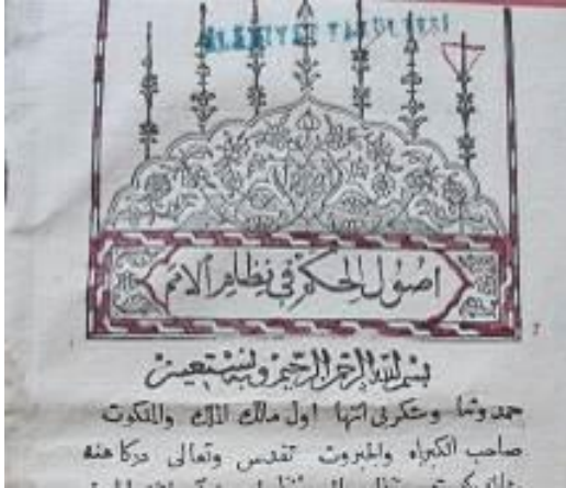
Resim 11: Usulü'l-Hikem Fi Nizâmi'l-Ümem Unvan Sayfası Tezvinatı