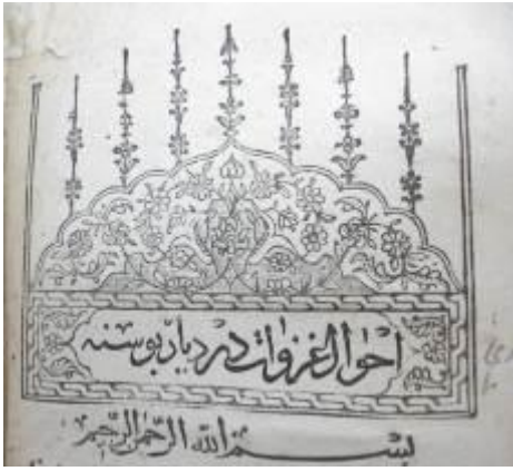
Resim 15: Ahvâl-i Gazavât Der Diyar-ı Bosna , Unvan Sayfası Tezminatı