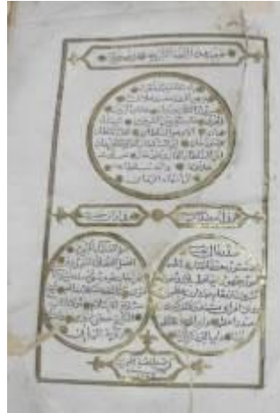
Resim 7: Ferheng-i Şu'ûri I. Cilde Ait Zahriye Sayfası

Klasik yazma eserlerde zahriye sayfasını, metnin başladığı ilk sayfa olan serlevha/ unvan sayfası takip etmektedir. 15 Bu sayfada genellikle metni süsleyen tezhipli başlık bölümü