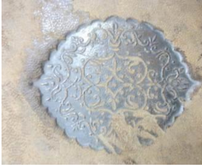
Resim 3: Ferheng-i Şu'ûri I. Cildine Ait Kapak Teziniatı