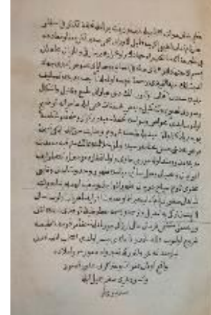
Resim 21: Tarih-i Seyyah Hatime Sayfası