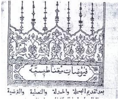
Resim 15: Füyuzât-ı Mıknâtsiyye Unvan Sayfası Tezminatı (Kut, 1996, S. 52)

Füyûzât-ı Mıknâtsiyye ve Takvîmü't Tevârih kitaplarının unvan sayfalarının taç tezhibleri klasik tarzda yapılmış olsa da diğerlerinden biraz farklıdır. Füyûzât-ı Mıknâtsiyye 'de sayfanın taç kısmında palmet, rumi motiflerinin aralarında yaprak, sap ve penç motiflerinin kullanıldığı bitkisel bir kompozisyon görülmekte ve etrafında dendan üzerinde ince işlemeli yer yer bitkisel motiflerin kullanıldığı tığlar bulunmaktadır. Kitap ismi geometrik geçme motifli cetvel ile çerçevellenmiş ve yazının her iki tarafında tezhip sanatında köşebent olarak adlandırılan alan bölümleri bulunmaktadır. Çerçevesiz olan sayfa kompozisyonunun sol alt kısmında reddade kullanılmıştır. (Resim 19) Benzer bir düzenleme Takvîmü't Tevârih kitabının unvan sayfası taç tezhibinde daha basit yapılmıştır. Bezemesinde palmet, rumi, penç, sap ve yaprak motiflerinin kullanıldığı bitkisel kompozisyonun etrafında dendan kullanılmıştır. Besmele ve kitabın ismi kalıp olarak basılmıştır. (Resim 21)