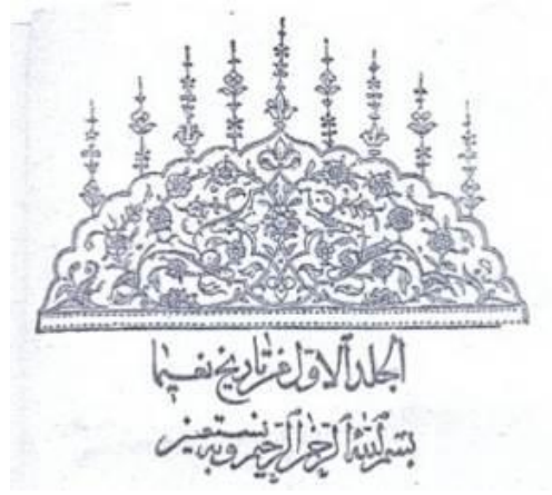
Resim 12: Tarih-i Nâima Unvan Sayfası Tezvinatı (Türk Kitap Medeniyeti, 2008, S. 110)

Tarih-i Raşid kitabının üç cildi ve de Tarih-i Çelebizâde kitabının ilk sayfalarının kompozisyonları, Tarih-i Naima kitabının ilk sayfasının kompozisyonuyla aynıdır. Taç tezvinlerinde aynı kalıbın kullanıldığı görülmektedir. (Resim 13-14)