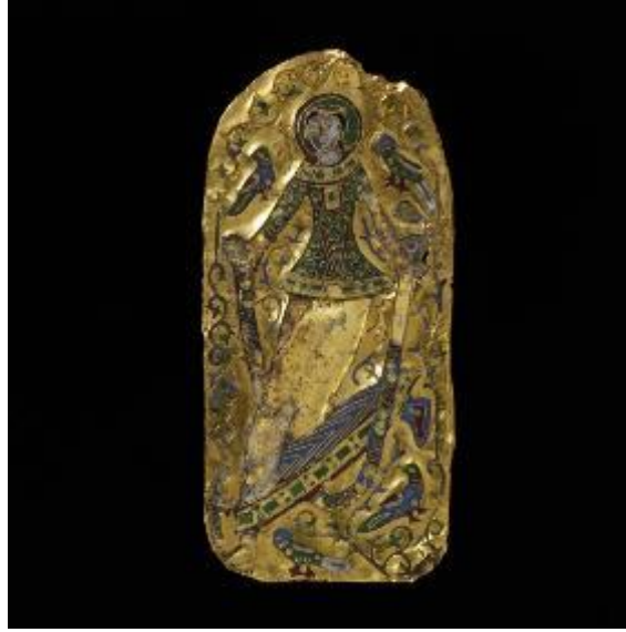
10. 8. Levha ön görünüm. http://collections.vam.ac.uk/item/O103209/plaque-unknown/