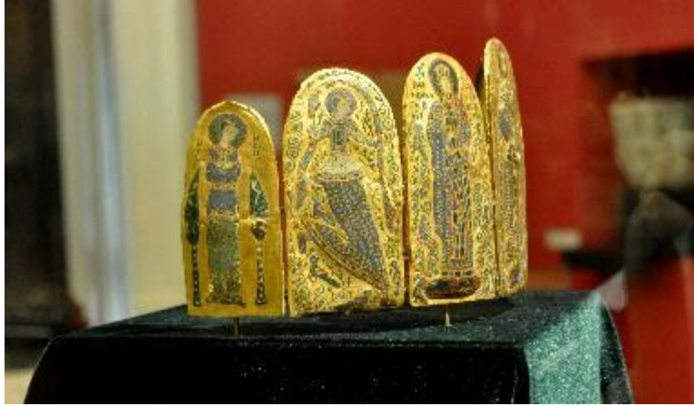
6. Monomakhos Tacı sol yan görünüm. Yılmaz Büktel