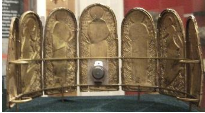
9. Monomakhos Tacı arka görünüm. Johnbod, Crown_of_Konstantinos_IX_Monomakhos_DSCF8087_06.JPG