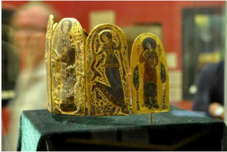
7. Monomakhos Tacı sağ yan görünüm. Yılmaz Büktel