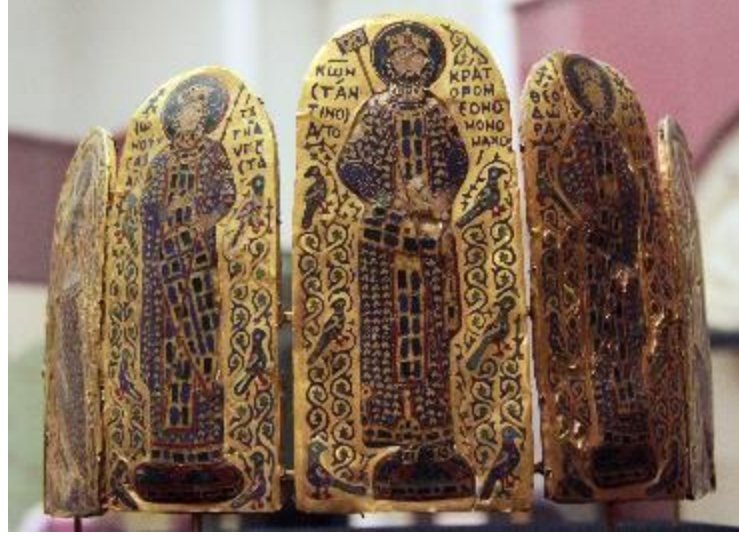
3. Monomakhos Tacı ön görünüm, Kotomi, .5687599051_1f28701358_o.jpg