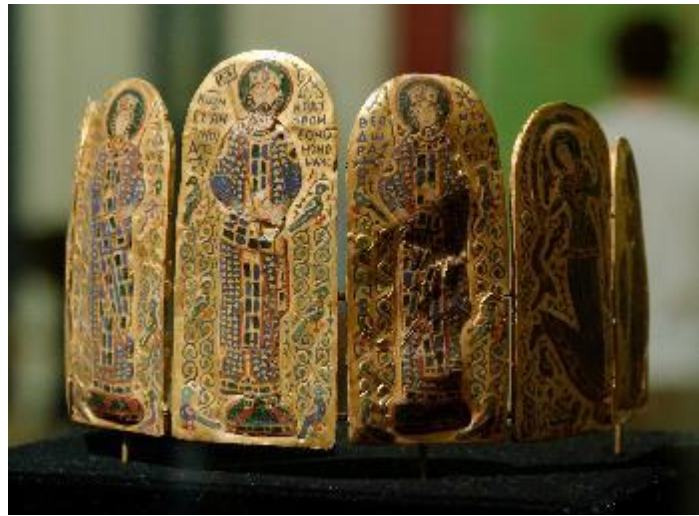
5. Monomakhos Tacı sağdan görünüm.