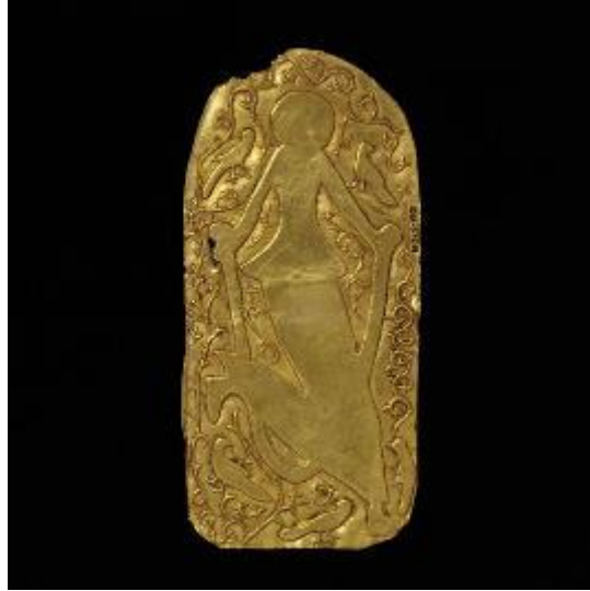
11. 8. Levha arka görünüm. http://collections.vam.ac.uk/item/O103209/plaque-unknown/