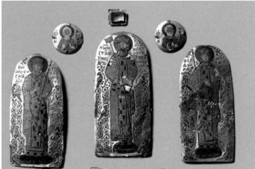
8. Madalyonlar ve imparatorluk levhaları. Etele Kiss, a.g.m