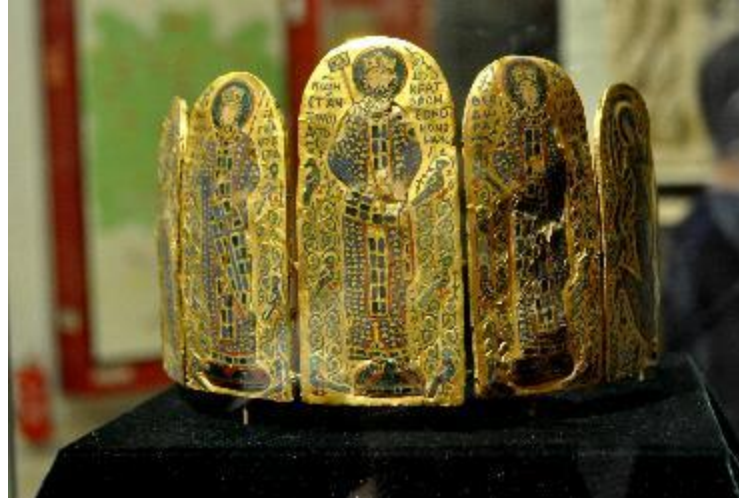
4. Monomakhos Tacı ön görünüm. Yılmaz Büktel