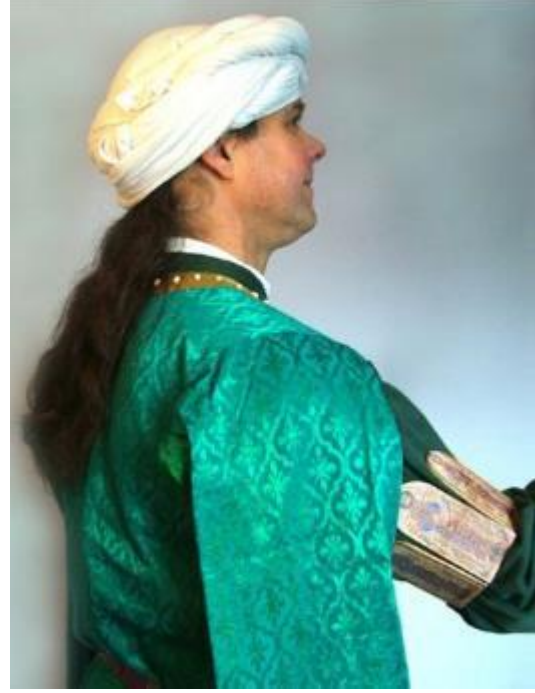
Şekil 2: Monomakhos Tacı-Modelleme ( H.P. Mittchell) Şekil 3: Monomakhos Kol Bandı ( Timothy Dawson)

Zamanı için oldukça güzel bir tasarım ancak levhaların ölçüleri göz önüne alındığında yeni eklenen levha 11 cm.lik ölçüsüyle Tacın genişliği 47.5 cm. ulaşır ki yine ortalama bir kadın başı genişliğine ulaşamamış olması bu tasarımın zayıf halkasıdır. Ancak 54 cm ulaşmanın bir başka yolu olabilir. Yukarı bölümde yer verdiğimiz Maguire'in figürlerin bakışları üzerine olan saptamalarında, Zoe'nin eşine, Eşi Monomakhos'un da eşiyile aynı yöne baktığı belirtilmiş ve burada imparatorun orada olması muhtemel bir Hz. İsa levhasına baktığı yorumu getirilmişti. İşte bugün izi bile olmayan ancak var olabileceği düşünülen bu 9. Levhayı hesaba katarsak 47,5 cm.lik genişlik 54 cm.i geçecek ve 59,5 cm.e ulaşacaktır. Taç gerekli genişliğe ulaşmış olsa da yeni bir levhanın eklenmesiyle Dr. Bock'un yaptığı tasarım şekli değişmek durumunda kalacaktır. Tasarımın bozulacağını ileri sürenler olabilir ancak insan başının alın çevresinin daha geniş olabileceğinden hareketle ön yüzde Hz. İsa'nın da olacağı 4 levhalı bir düzenlemenin Dr. Bock'ın tasarımına zarar vermeyeceğini düşünüyoruz.