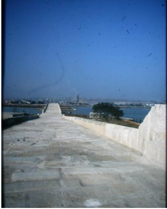
Şekil. 7 Büyükçekmece Köprüleri