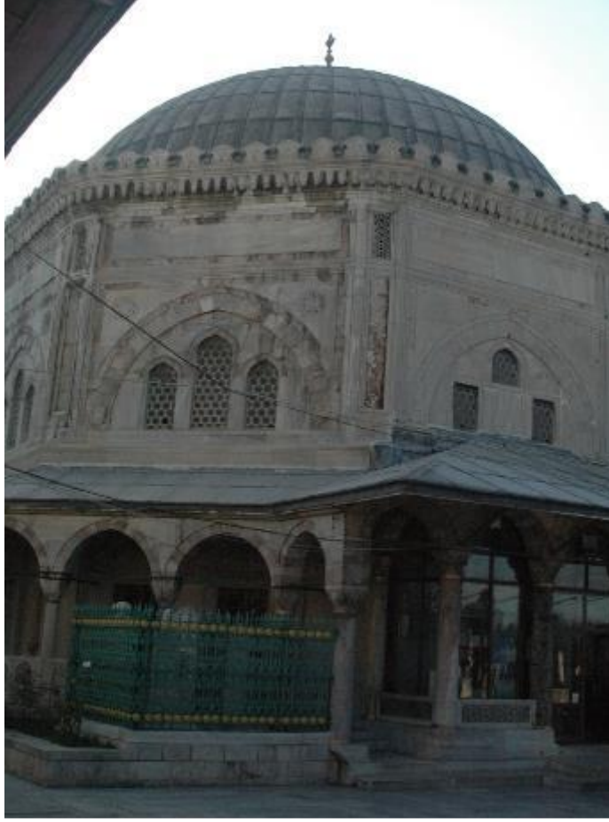
Şekil.11 İstanbul Kanuni Sultan Süleyman Türbesi Giriş Cephesi