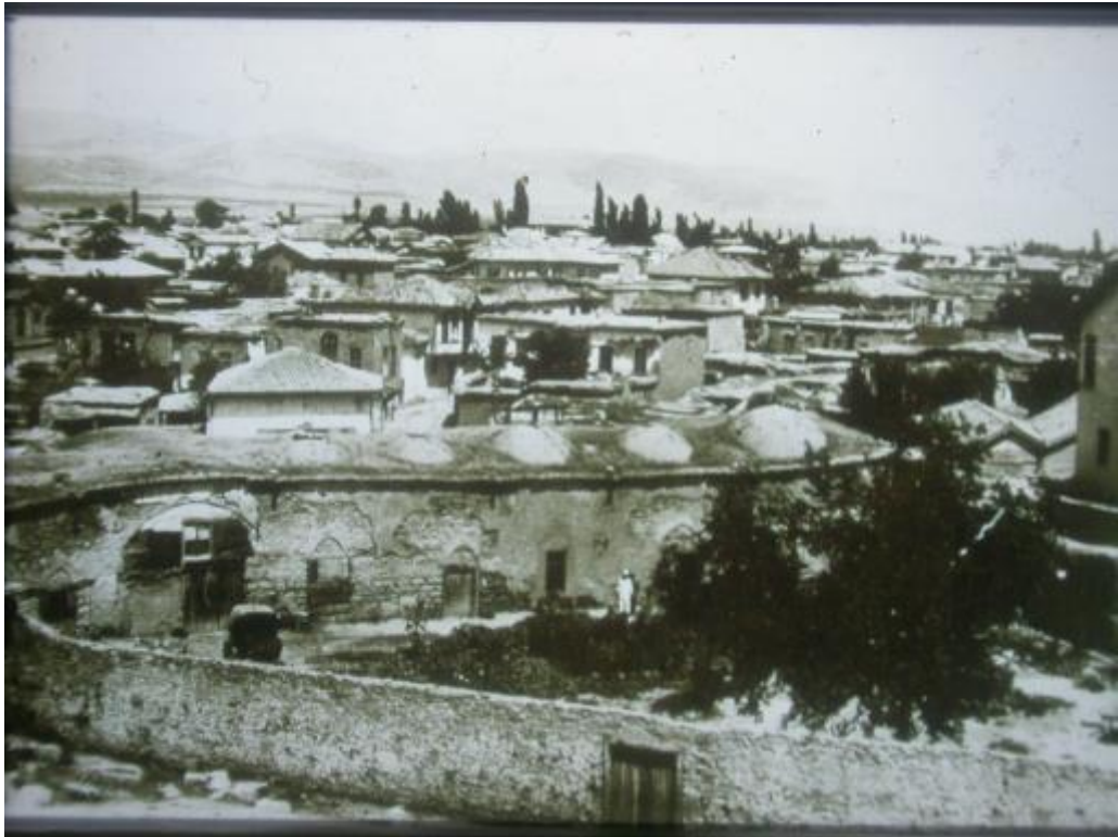
Şekil. 2 Konya Selimiye Külliyesi Eski Bir Görünümü