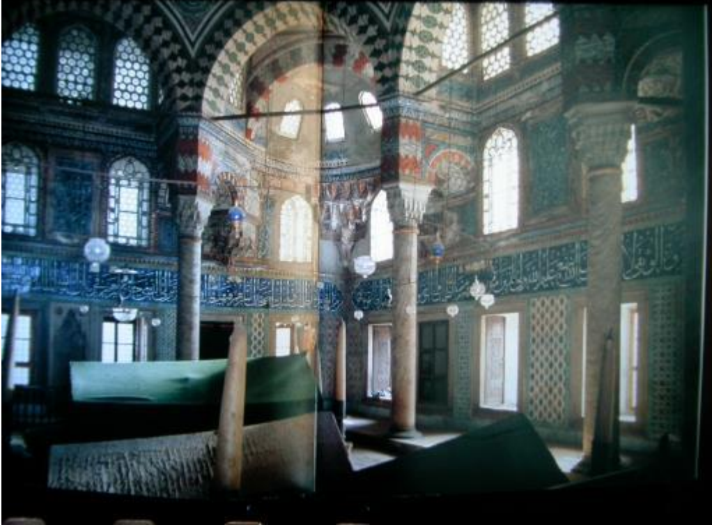
Şekil.20 İstanbul Ayasofya Avlusu – Sultan II: Selim Türbesi