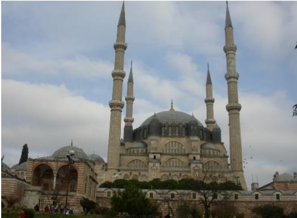
Şekil.14 Edirne Selimiye Camisi Mektebi ve Arastası