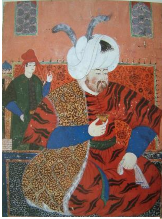
Şekil. 1 Nigârî, Şehzade Selim'in meclisi, H.Ü. San. Tar. Bl. Arş.