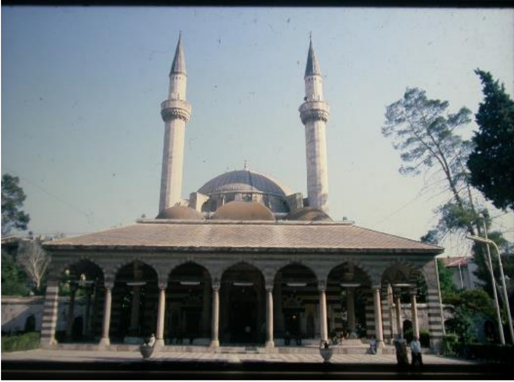
Şekil. 10 Suriye – Şam, Süleymaniye Camii Kuzey Cephe