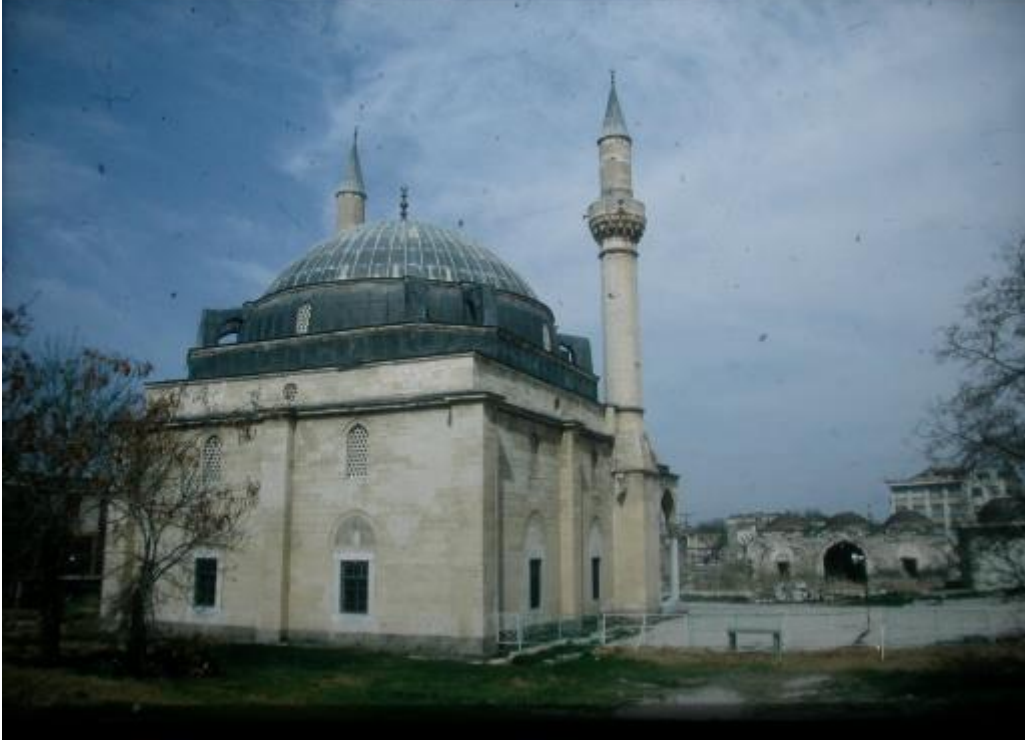
Şekil. 6 Karapınar Selimiye Camii