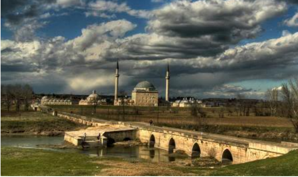
Şekil.16 Edirne Yalnız Göz Köprüsü ve II. Bayezid Külliyesi (GÖKHAN GÜNDOĞDU)