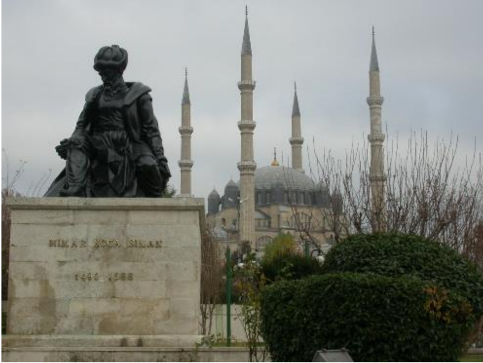
Şekil.13 Edirne Selimiye Camisi ve Mimar Sinan Heykeli