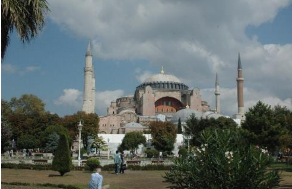
Şekil.18 İstanbul Ayasofya Kilise Camii Genel görünüm