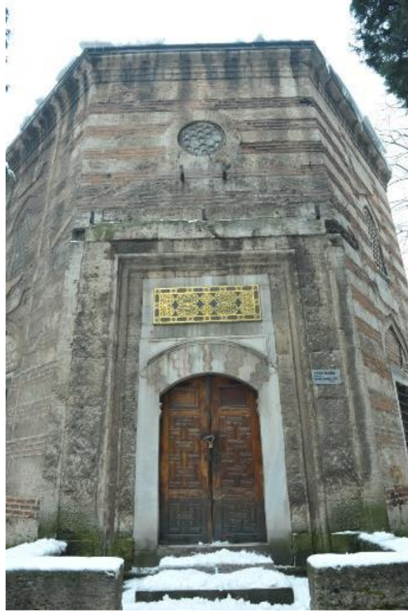
Şekil.17 Bursa Muradiye Haziresi, Şehzade Mustafa Türbesi