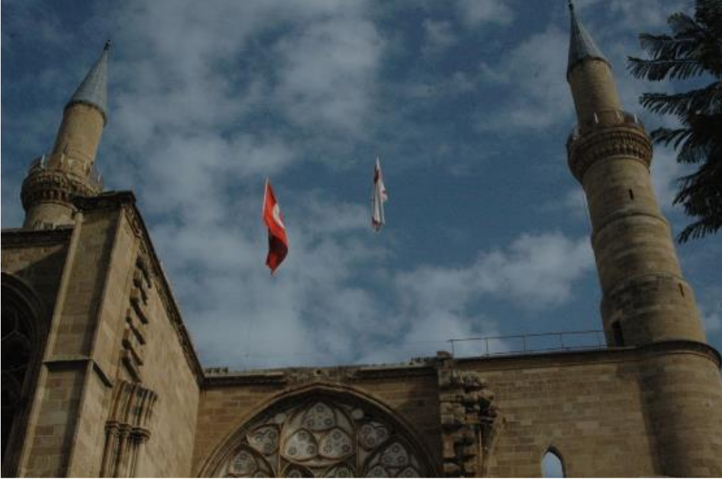
Şekil.21 Kıbrıs Lefkoşa Selimiye Camii Giriş Cephesi