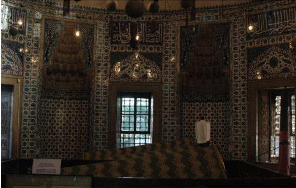
Şekil.12 İstanbul Kanuni Sultan Süleyman Türbesi İç Görünüm