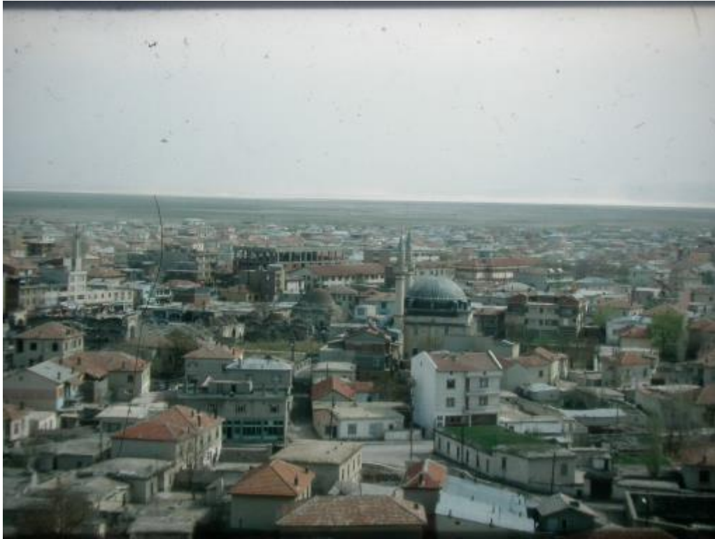
Şekil. 4 Karapınar Selimiye Külliyesi ve Şehir Dokusu