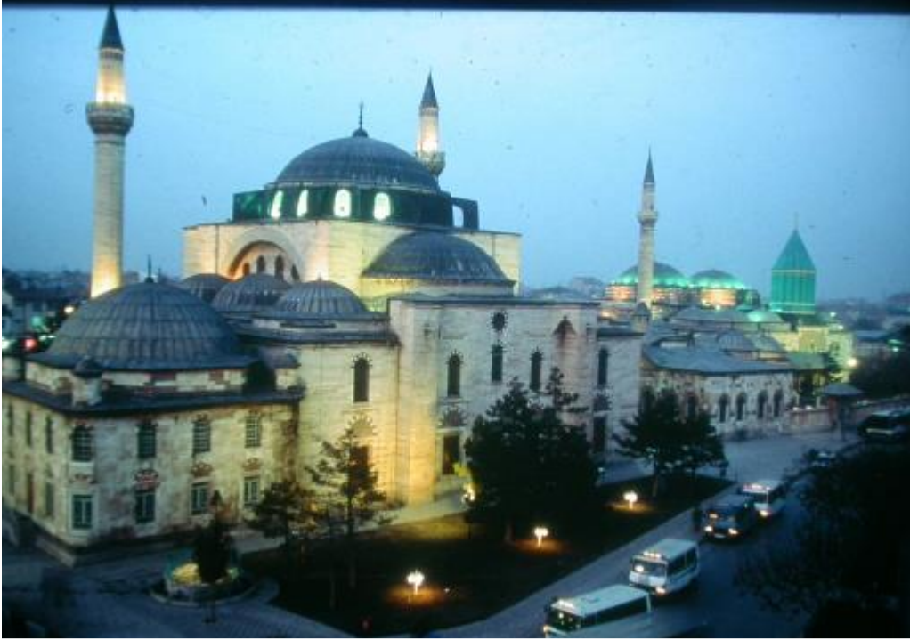
Şekil. 3 Konya Selimiye Camii ve Mevlana Müzesi