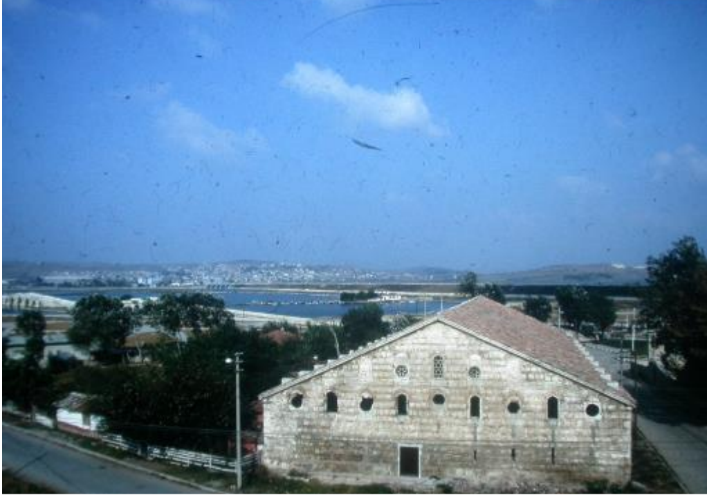
Şekil. 8 Büyükçekmece Kervansarayı ve Köprüler