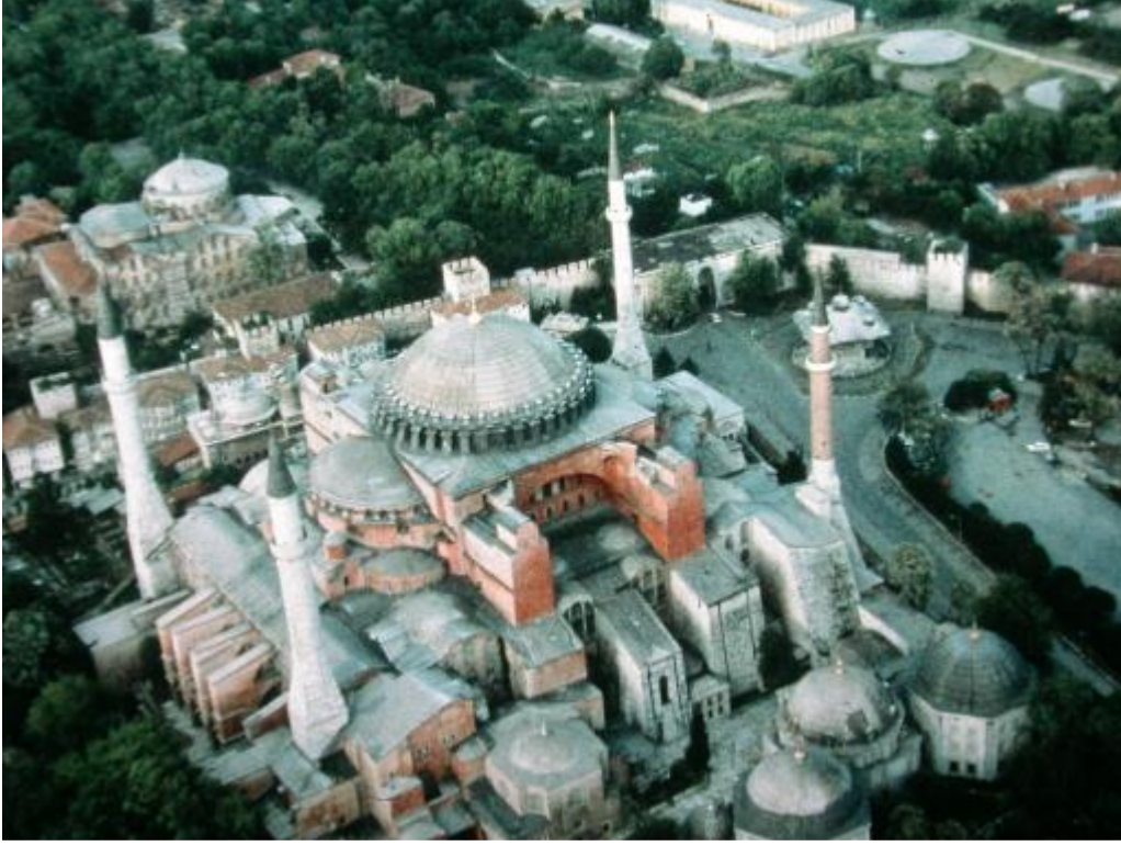
Şekil.19 İstanbul Ayasofya Topluđu Üsten Görüntü Kùltür ve Turizm Bakanlıđı Arşivi