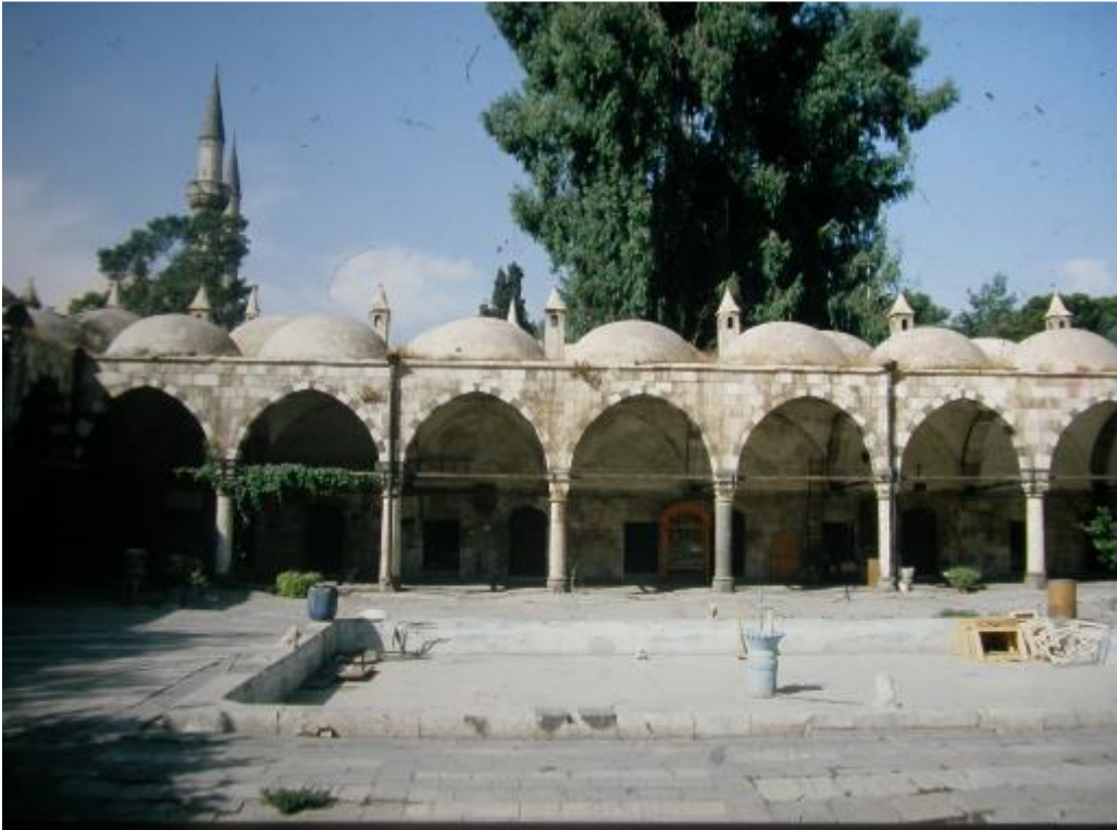
Şekil. 10 Suriye-Şam, Selimiye Medresesi Avlu ve Revatlar