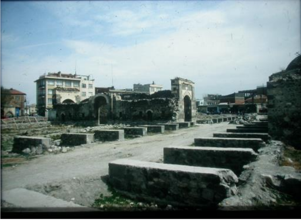
Şekil. 5 Karapınar Selimiye Külliyesi Kazı Sonrası