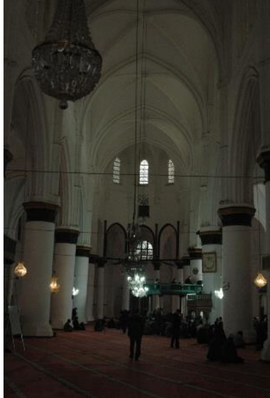
Şekil.22 Kıbrıs Lefkoşa Selimiye Camii İç Görünüm