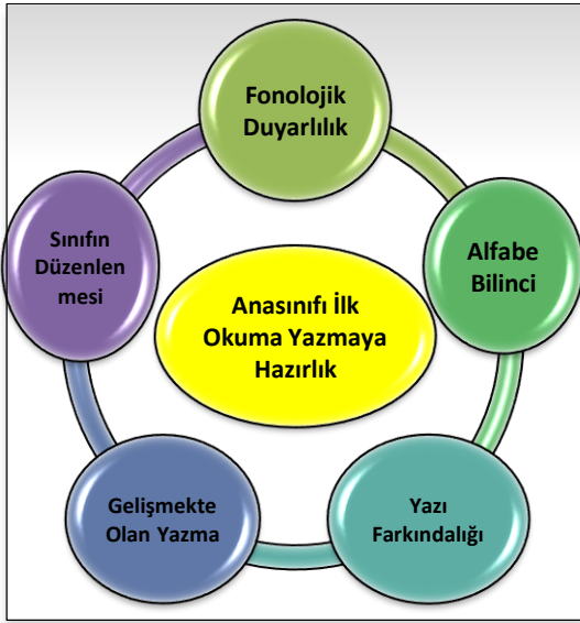
Şekil 1. Anasınıfı Okuma Kitabı İçeriği.

Aşağıda yer alan Şekil 1 ve Şekil 2 incelendiğinde, anasınıfında ilk okuma yazmaya hazırlık ve ilköğretimde okuma öğreniminde ses farkındalığı, alfabe bilinci, yazı bilinci ve kelime haznesinin gelişiminin önemli bir yere sahip olduğu görülmektedir. Yapılan çalışmada anasınıfı ve birinci sınıf okuma kitapları aşağıda yer alan alanlara göre incelenmiştir.