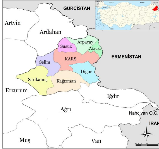
Harita 1. Kars İli ve Çevresinin Lokasyonu

Son yıllarda eğitim ve turizm sektörlerinde önemli gelişmeler yaşanmış olmasına karşın, temelde ekonomisi tarım ve hayvancılığa dayanmakta olan ilde son yıllarda uygulanan tarım politikaları nedeniyle işsizlik oranları giderek artmaktadır.