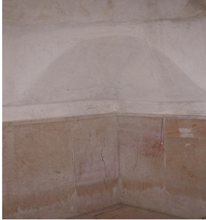
Foto. 5. İkinci sıcaklık bölümü kubbeye geçiş sistemi