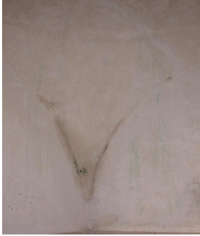
Foto. 4. Birinci sıcaklık bölümü kubbeye geçiş sistemi