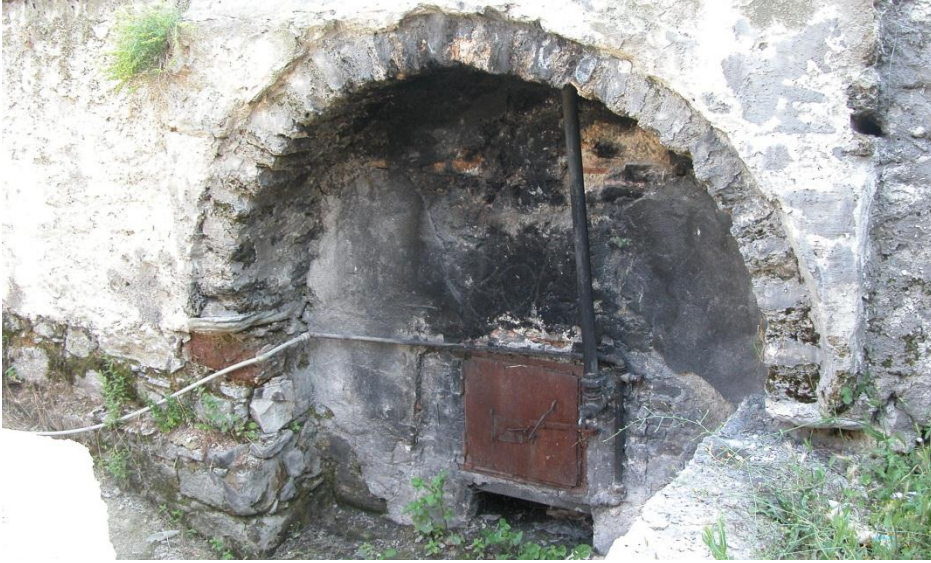
Foto. 7. Külhan nişi ve kemeri