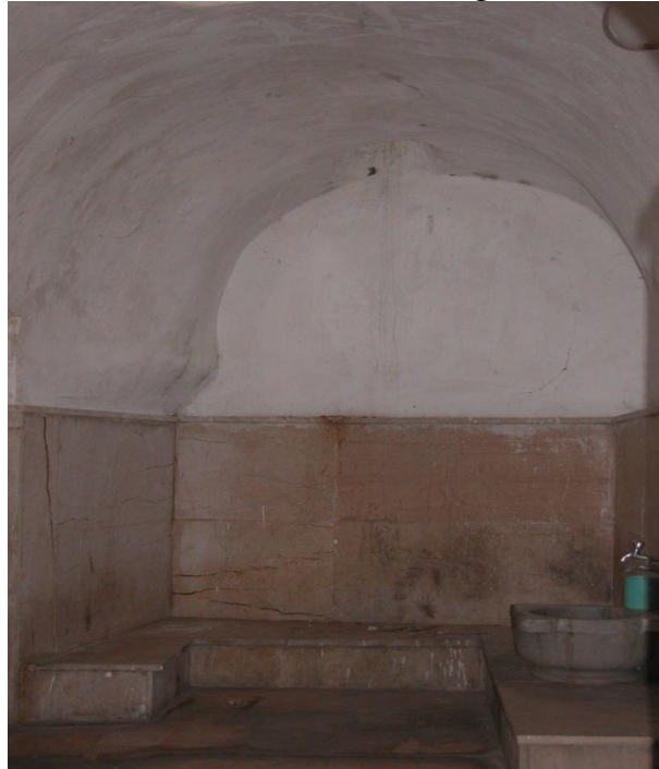
Foto. 3. Hamamın ılıklik bölümü