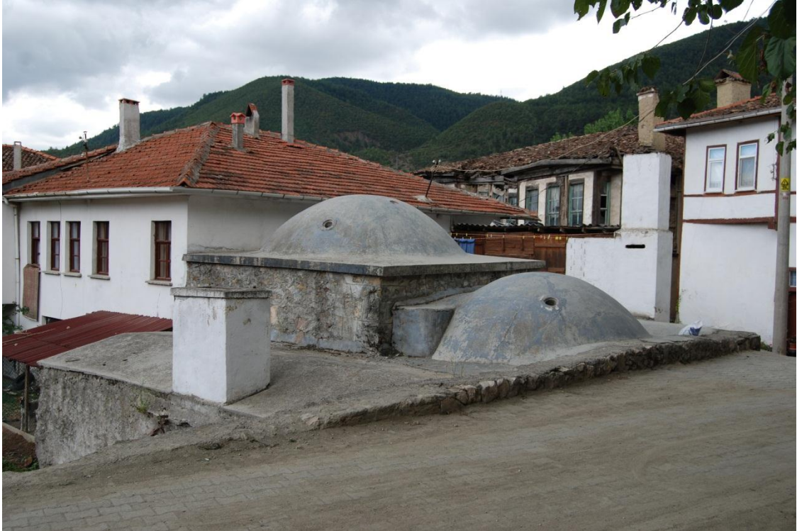
Foto. 1. Taraklı Yunus Paşa Hamamı'nın genel görünümü