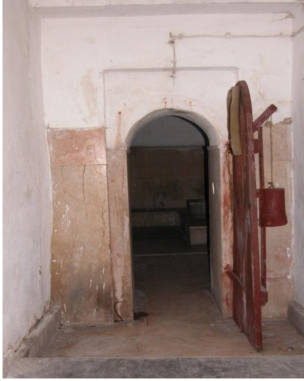
Foto. 2. Hamamın ılıklik bölümüne geçit veren kapısı