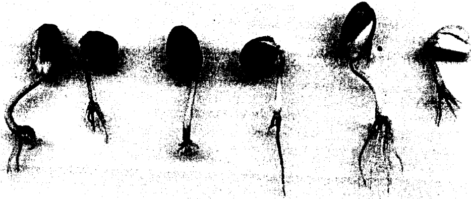
Şekil 2. Çimlendikten sonra bir süre kurutulan veya su içerisinde bekletilen kayın tohumlarının tekrar çimlendirmeye alındıktan sonraki kökçük gelişimleri (Foto: M.Yılmaz).

Figure 1. Seedlings belong to clipping and control treatments. Two seedlings with single taproots at the right were produced by the control treatment. The second seedling from the left belongs to clipping treatment. Seedling at the left is one of the ten control seedlings with main roots more than one (Foto: M.Yılmaz).