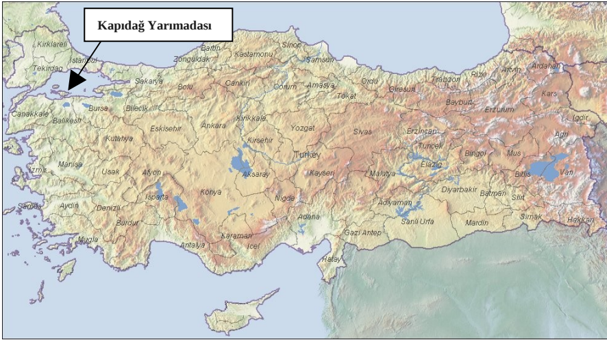
Şekil 1. Kapıdağ Yarımadası.

Araştırma alanı Marmara Bölgesi'nin güneyinde Marmara Denizi'ne doğru uzanan, batıda Erdek, doğuda Bandırma Körfezleri arasında yer alan üçgen şeklinde bir yarımada (Şekil 1). Yarımada 28496.40 hektarlık bir alana sahiptir. Yarımada'nın 17685.80 hektarını orman alanı, 10810.60 hektarını ise yerleşimler, tarım alanları, meralar vb. oluşturmaktadır (Hızal, 2007).