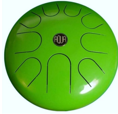
Şekil 4. Baby aqua drum

Baby Aqua Drum: Aqua drum eller ya da malet (ucu yumuşak baget) ile çalınabilen çelikten melodik bir vürcümlü çalgıdır. Ses rengi suya benzer bir pürüzsüzlüğü hatırlatır. Aynı zamanda çocuklarda otizmin tedavisinde ya da yoga ve meditasyon seanslarında terapi edici olarak da kullanılır. Baby aqua drum normal boydan daha küçük olup, pentatonik (beş sesli) bir diziye sahiptir. Özellikle çocukların kendi doğal armoni ve ritim duygularının gelişmesine yardımcı olur.