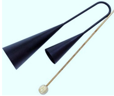
Şekil 1. Agogo

Ahşap Tren Düdüğü: Çalgı olmaktan çok ses çıkaran bir oyuncak olma özelliği ve üzerindeki renkli dekoruyla, üfleyerek ses çıkarma eylemini eğlenceli hale getirir ve özellikle çocukları nefesli çalgılara hazırlar.