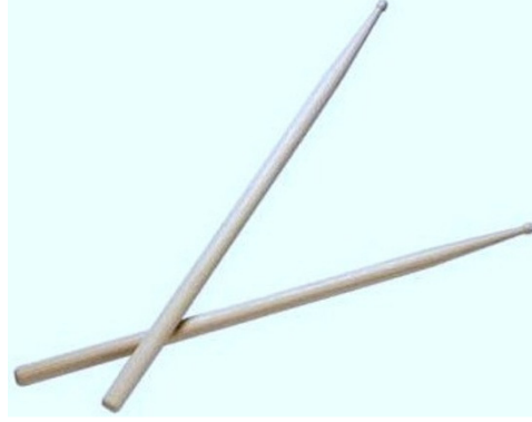
Şekil 5. Baget(ler)

Blok Flüt: Avrupa orijinli nefesli bir çalgı olarak genellikle plastik veya ağaçtan, bazen de fildişinden yapılır. Yedisi üstte, biri altta olmak üzere sekiz deliği vardır. Yaklaşık iki oktavdır ve soprano, alto, tenor ve bas gibi çeşitleri vardır.