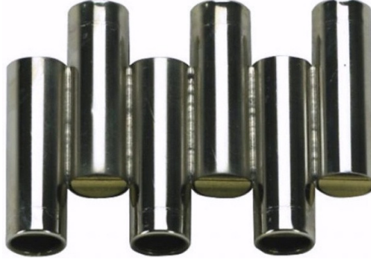
Şekil 3. Akort düdüğü

Baby Aqua Drum: Aqua drum eller ya da malet (ucu yumuşak baget) ile çalınabilen çelikten melodik bir vürcümlü çalgıdır. Ses rengi suya benzer bir pürüzsüzlüğü hatırlatır. Aynı zamanda çocuklarda otizmin tedavisinde ya da yoga ve meditasyon seanslarında terapi edici olarak da kullanılır. Baby aqua drum normal boydan daha küçük olup, pentatonik (beş sesli) bir diziye sahiptir. Özellikle çocukların kendi doğal armoni ve ritim duygularının gelişmesine yardımcı olur.