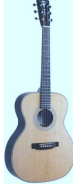
Şekil 15. Klasik gitar

Kurbağa: Çalgı olmaktan çok ses çıkaran bir oyuncak olma özelliği ve tahta çubukla üzerine sürtüldüğünde kurbağa benzeri eğlenceli bir ses çıkararak özellikle çocukları guiro çalmaya hazırlar.