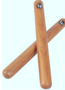
Şekil 21. Ritim çubukları

Tenis Topu: Çalgı olmaktan çok farklı zamanlı vuruşların tenis topunun eş zamanlı hareketiyle koordinasyonu için kuvvetli ve zayıf zamanlı vuruş çalışmalarıyla çeşitli oyunlar oynanarak, müzikte zaman kavramı oluşturmak için kullanılır.