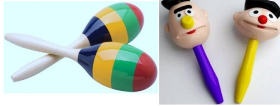
Şekil 17. Marakas

Metronom (Lehera): Sabit bir tempo elde etmek amacıyla belli aralıklarla vuruş sesleri çıkartan mekanik ve dijital metronomlar kullanıldığı kadar, özellikle Hint müziğinde bir ritim çalgısı ile birlikte kullanılan ve belirlenen herhangi bir tempoda sürekli tekrarlanan ( ostinato ) sabit bir melodik motif ( raga ) sunan bir nevi “melodik metronom” ( lehera ) da kullanılır. Leheraya kayıtlı tala denen ritmik motifler sayesinde doğru vurgularla ritmik açıdan müzik cümlesinin doyuruculuğu ve tonlamaların ayırtına varmak ve zamanları saymak kolaylaşır.