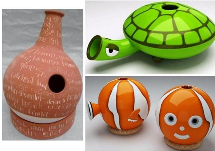
Şekil 24. Udu

Udu: Aslen Afrika orijinli olup, testi biçimli ancak gövdesinde fazladan bir delik daha olan ve delikleri kapatılarak çalınan, pişmiş topraktan yapılan vurmali bir çalgıdır.