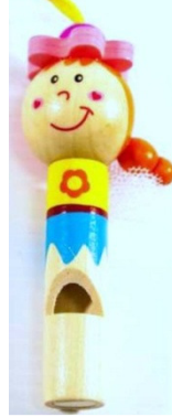
Şekil 2. Ahşap tren düdüğü

Ahşap Tren Düdüğü: Çalgı olmaktan çok ses çıkaran bir oyuncak olma özelliği ve üzerindeki renkli dekoruyla, üfleyerek ses çıkarma eylemini eğlenceli hale getirir ve özellikle çocukları nefesli çalgılara hazırlar.