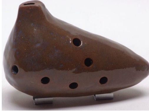
Şekil 20. Okarina

Ritim Çubukları (Klave): Latin Amerika (Küba ve Brezilya)’da “clave” (şifre) ritimlerini çalmak için kullanılır.