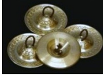
Şekil 9. El zil(ler)i

Eşarp: Ritim algısının herhangi bir obje yardımı ile bedende hissedilmesiyle ifade özgürlüğü ve yaratıcı düşünce güçlerinin gelişimine olanak sağlar.