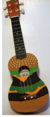
Şekil 25. Ukulele

Viyola: Yaylı çalgılar ailesindedir, şekli ve tutuşu kemana benzemekle beraber kemandan biraz daha büyük ve alto sese sahip bir çalgıdır.