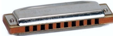
Şekil 19. Mızık

Mızık: Deliklerine üflenen hava ile çalınan nefesli bir çalgıdır.