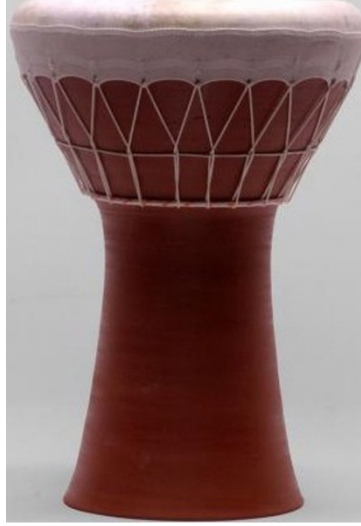
Şekil 23. Toprak darbuka

Udu: Aslen Afrika orijinli olup, testi biçimli ancak gövdesinde fazladan bir delik daha olan ve delikleri kapatılarak çalınan, pişmiş topraktan yapılan vurmali bir çalgıdır.