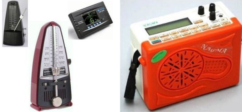
Şekil 18. Metronom

Mızık: Deliklerine üflenen hava ile çalınan nefesli bir çalgıdır.