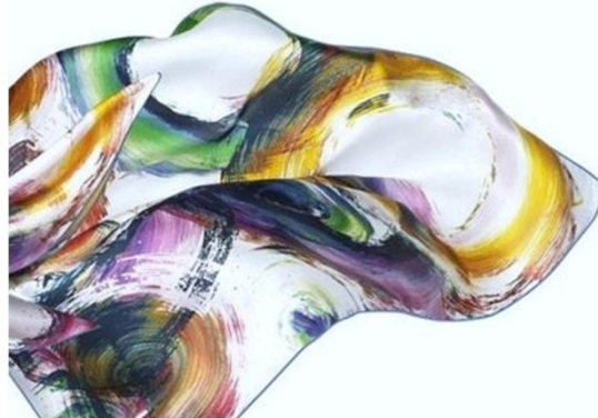
Şekil 10. Eşarp

Eşarp: Ritim algısının herhangi bir obje yardımı ile bedende hissedilmesiyle ifade özgürlüğü ve yaratıcı düşünce güçlerinin gelişimine olanak sağlar.