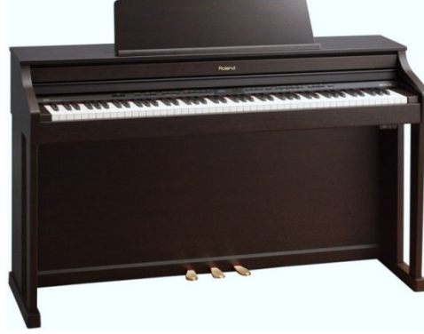
Şekil 8. Dijital piyano

El Zil(ler)i: Aslen Asya orijinli olup, Türk müziğinde ve diğer birçok Orta Doğu ülkesinin müzik kültüründe var olan bir ritim çalgısıdır. İki dairesel bakır veya pirinç levhadan oluşur. Ortasında deriden ya da ipten tutma yerleriyle parmaklara geçirilerek, iki zilin birbirine vurulmasıyla çalınır. Farklı müzik türlerinde kullanılan çeşitli boylarda ziller de vardır.