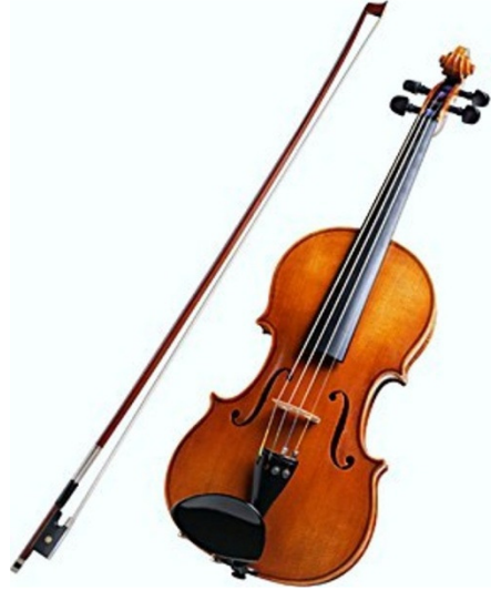
Şekil 26. Viyola

Yumurta (chicken shake): Shaker çeşitleri aslen Afrika orijinli olup, farklı görünümüleriyle birçok müzik eşliğinde kullanılır.