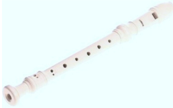
Şekil 6. Blok flüt

Çelik Üçgen: Brezilya’da yaygın olarak kullanılır. Orijinal adı, bir metal çubuğun üçgen şekli oluşturacak şekilde bükülmesiyle oluşan şeklinden ötürü “triangle” olup, yine küçük bir metal çubukla çalınır.