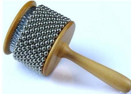
Şekil 13. Kabasa

Kabasa: Brezilya'da yaygın olarak kullanılmaktadır ve ağaç saplı, metal oluklu gövde üzerindeki boncuklarla çalınır.