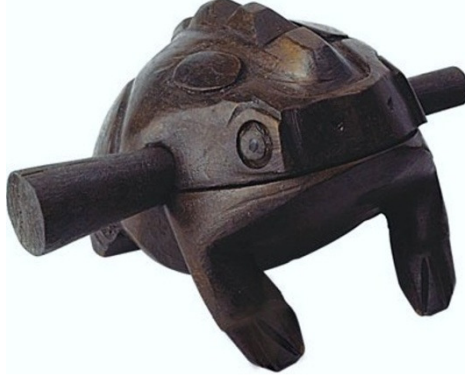
Şekil 16. Kurbağa

Kurbağa: Çalgı olmaktan çok ses çıkaran bir oyuncak olma özelliği ve tahta çubukla üzerine sürtüldüğünde kurbağa benzeri eğlenceli bir ses çıkararak özellikle çocukları guiro çalmaya hazırlar.