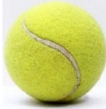
Şekil 22. Tenis topu

Tenis Topu: Çalgı olmaktan çok farklı zamanlı vuruşların tenis topunun eş zamanlı hareketiyle koordinasyonu için kuvvetli ve zayıf zamanlı vuruş çalışmalarıyla çeşitli oyunlar oynanarak, müzikte zaman kavramı oluşturmak için kullanılır.