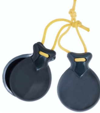
Şekil 14. Kastanyet

Klasik Gitar: Gitar türlerinin en sadesi olarak tanımlanır. Kalın üç tel çelik, ince üç tel ise naylondur ve genellikle parmakla veya pena ile çalınır.