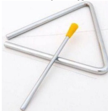
Şekil 7. Çelik üçgen

Çelik Üçgen: Brezilya’da yaygın olarak kullanılır. Orijinal adı, bir metal çubuğun üçgen şekli oluşturacak şekilde bükülmesiyle oluşan şeklinden ötürü “triangle” olup, yine küçük bir metal çubukla çalınır.