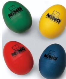
Şekil 27. Yumurta

Yumurta (chicken shake): Shaker çeşitleri aslen Afrika orijinli olup, farklı görünümüleriyle birçok müzik eşliğinde kullanılır.