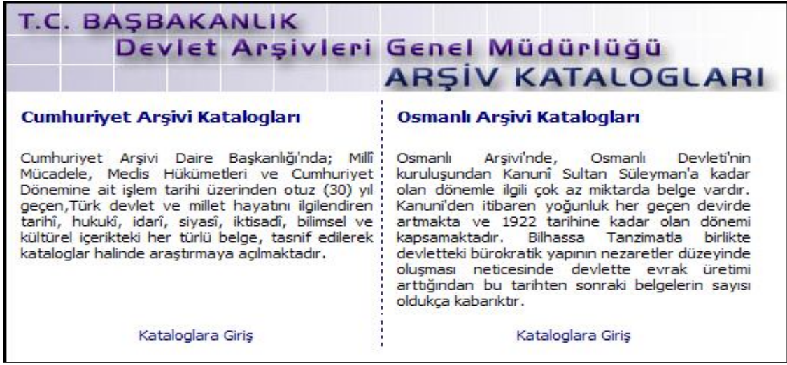
Resim 2: Katalog Seçim Ekranı (Adım 2)

(Kaynak: "Kataloglara Giriş", [Çevrimiçi] Elektronik adres: http://www.devletarsivleri.gov.tr/katalog 20.04.2010.)